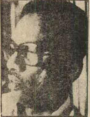
தொடர்ந்து பாசிச பாத்தாளிகளாக இருந்த கிருஷ்ண அப்பாரும் இப்போது “பாசிச எதிர்ப்பு ஜனநாயக உரிமை” பற்றிப் பேசுகிறார்கள்.

பாசிச-சுயேச்சைக்கார எதிர்ப்புக் கூட்டாளிகளின் முகவிலாசங்கள் அவர்களைக் காட்டிக்கொடுத்து விடுகின்றன. “கூட்டு” நடவடிக்கைகளின் பிரதான குருவான கேடயம்-மன ஓசை கும்பல் தமது சகபாடிகளான இந்திய மக்கள்