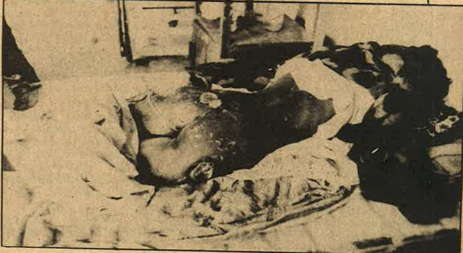
சிமென்ட் படைமீன் குண்டு வீச்சுக்கு தகவலான 14 வயது சிறுமி; யாழ் மருத்துவ மனையில் உயிருக்குப் போராடுகிறார்.

(மிரான்ஸ் நாட்டின் தமிழர் ஒருங்கிணைப்புக் குழு, ஐக்கிய நாடுகளின் மனித உரிமைக் கமிஷனுக்கு மே மாதத்தில் அளித்த அறிக்கையிலிருந்து)