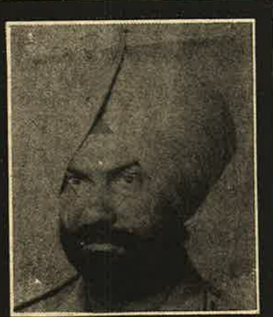
எஸ்.பி பஸ்தேவ் சிவ் பிரார்