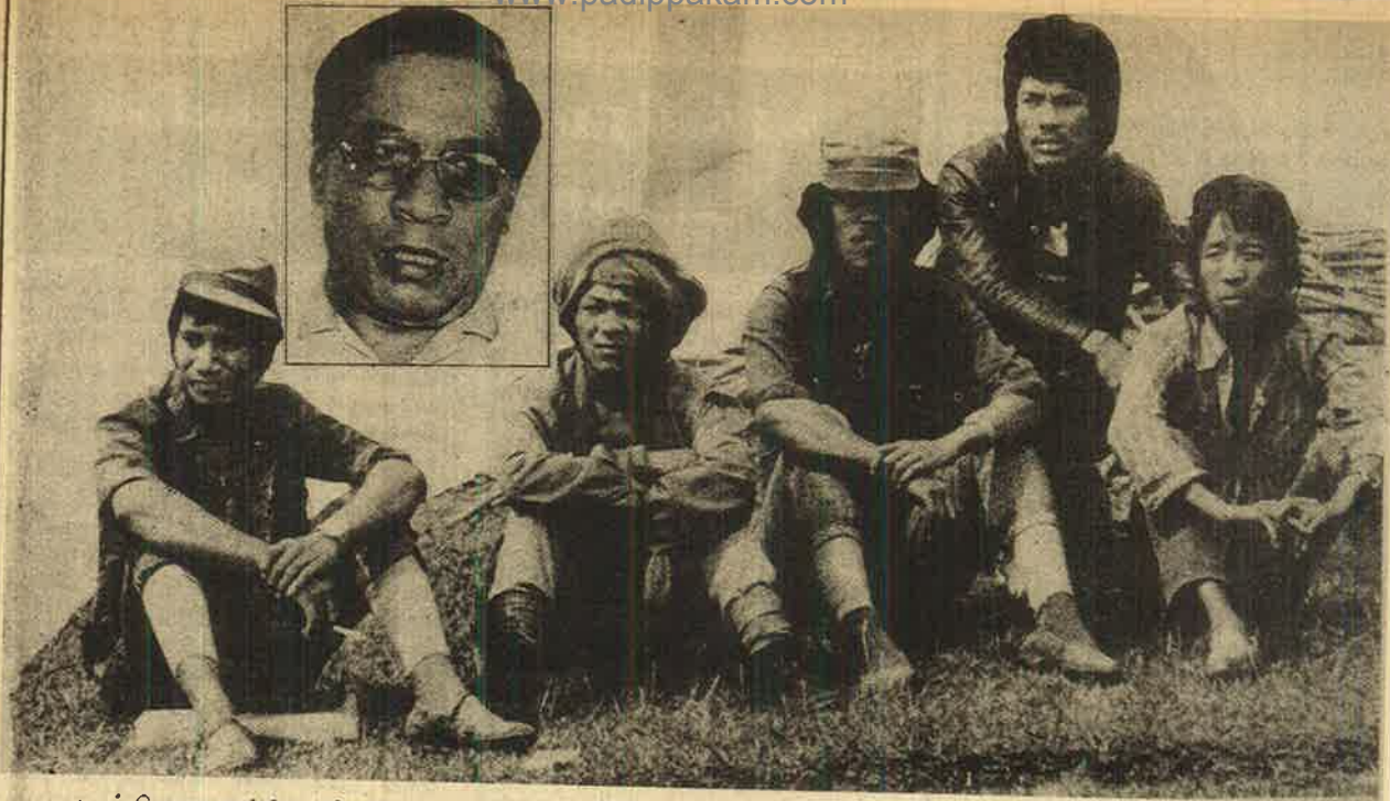
காங்கிரஸை நம்பிய மீனோ தேசிய முன்னணியின் சிப்சியைக் கவிழ்த்து நட்பாற்றில் விட்டது பாசிச ராஜீவ் சும்பல். உச்சிக்கப்பட்டு கிமாசம்பிபான மீனோ கதாசிரிஸ்க்கள். சிவர்கனின் குலைவரும் பதவி பநீபான முதல்வருமான லால்லெடங்கா.

கட்சியிலிருந்து எட்டு எம்எல்ஏக்கள் விலகி மிஜோ தேசிய ஜனநாயக முன்னணி என்ற புதிய கட்சி அமைத்திருப்பதாக அறிவித்தனர். 40 உறுப்பினர்களைக் கொண்ட மிஜோ சட்டமன்றத்தில் 25 பேராக இருந்த மிஜோ தேசிய முன்னணி இதனால் 17 பேராகக் குறுங்கியது.