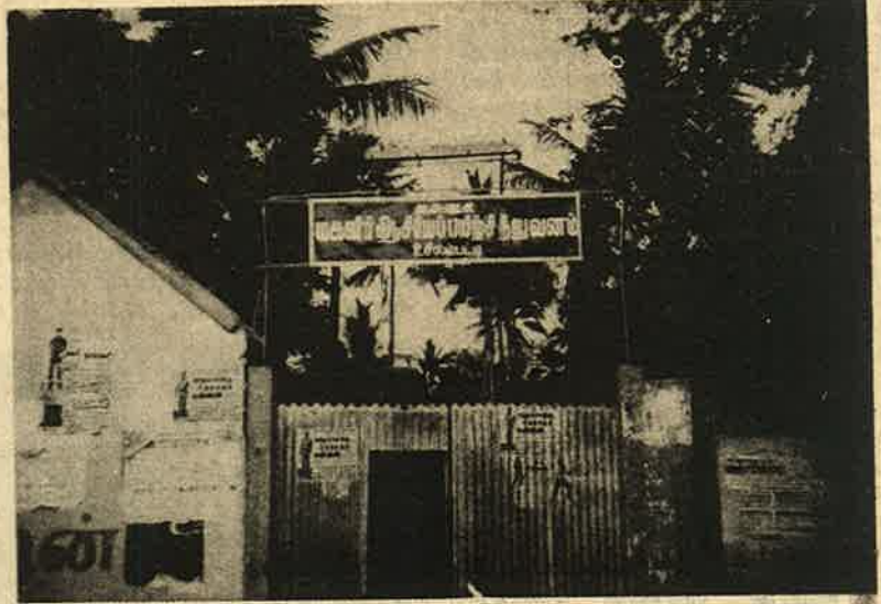
டி.இ.எல்.சி ஆசிரியை பயிற்சிப்பள்ளி, கொத்தடிமைக் கூடாரம், அப்பாவி மாணவிகளின் பஸ்பீடம்.