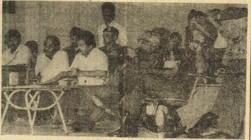
விந்திய உதிழாசிகரூடன் புலிகள் நடத்திய பேரம்.