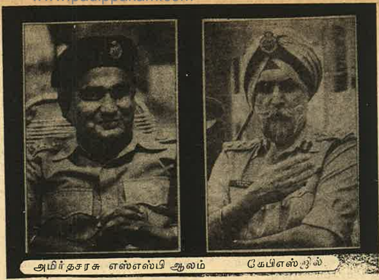
அமிர்தசரசு எஸ்.எல்.பி ஆலம்

அமிர்தசரசு நகர இந்திரா காங்கிரசுத் தலைவரின் காரைத் துப்பாக்கியைக் காட்டிப் பிடுங்கிக் கொண்டு போனான் ஒருவன். புகார் கொடுப்பதற்கு அவர் தலைமைப் போலீசு அதிகாரியின் வீட்டுக்குப் போனபோது காரைப் பிடுங்கிச் சென்றவன் அங்கே இருந்தான். அதாவது அவன் இரகசிய—அதிரடிக் கொலைப் படையைச் சேர்ந்தவன். தலைமை அதிகாரியின் உத்திரவின் பேரில் ஒருவரத்துக்குப் பிறகு காரைத் திருப்பிக் கொடுத்தான். ஆயுதங்களும் வெடி மருந்துகளும் ஏராள