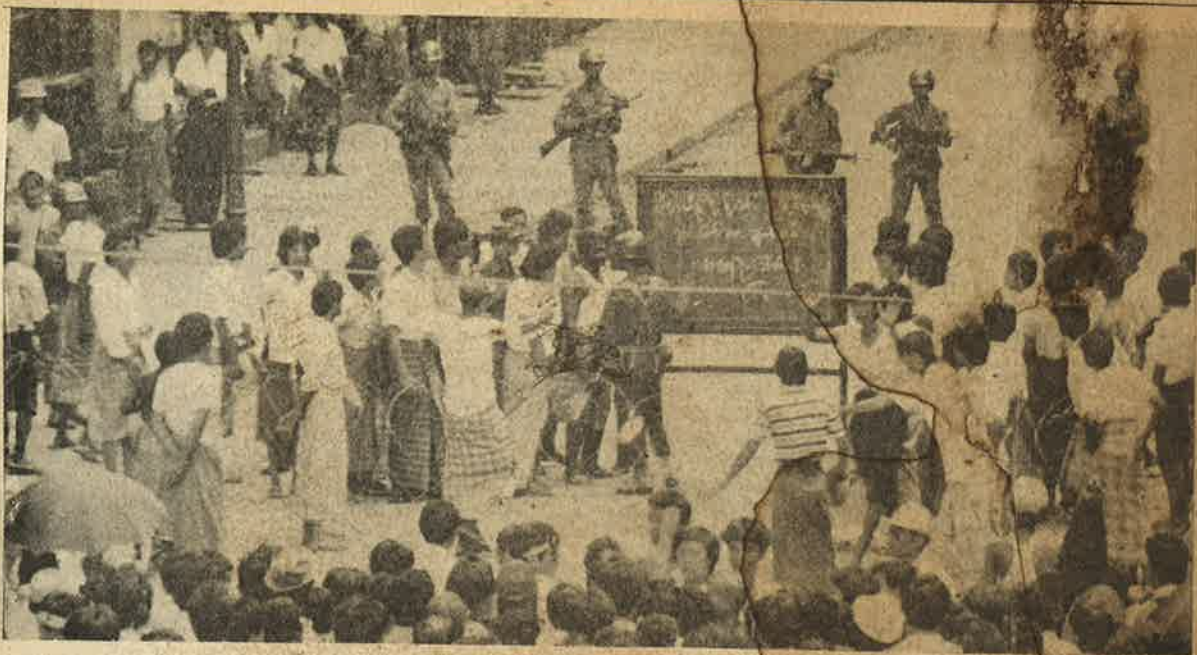
மாணவர்கள் ரங்கன் தெருக்களில் பெரும் ஆர்ப்பாட்டங்களை நடந்தினர். நீதினுடைய இரகசியப் போலீசுப் படைபினர் நூற்றுக்கணக்கான மாணவர்களைப் படுகொலை செய்தனர்.

“புதிய இராணுவ ஆட்சியாளர்களான தளபதிகளும் கர்னல்களும் பர்மிய ராணுவ அதிகாரிகளின் இரண்டாம் தலைமுறை பினர். சுதந்திரத்தை வென்ற பிறகு அதிகாரிகளாக முதிர்ச்சியுற்றவர்கள். கலக இயக்கம் மற்றும் (சீன) கோமின்டான் ஆக் பிரமிப்பு படைகளுக்கு எதிரான போராட்டத்தின் ஆரம்பம்—அபாயகட்டத்தில் அப்போது பர்மா இருந்தது. சீழ் அணிவரிசையிலிருந்து பதவியேற்றம் பெற அவர்களுக்கு உதவிய தேசிய விடுதலைப் போராட்ட அனுபவசாலிகளுக்கு நெருங்கிய, தார்மிக—சிந்தனை உடையவர்கள். இராணுவத்தின் ஒற்றுமையை ஒரு கூட்டாதிக்கக் கொள்கையாக மட்டும் இந்த அதிகாரிகள் கருதவில்லை; மாறாக நாட்டின் ஐக்கியம் மற்றும் பிரதேச ஒருமைப்பாட்டுக்கான தொரு நிபந்தனையாகக் கருதுகிறார்கள்.” (ஐ)