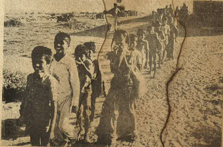
பையா கிராமத்தின் பள்ளிக்குழந்தைகள். பெண் சிசுக் கொலையில் தப்பிப்பிழைத்த ஒரே சிறுமி.

மறுக்கும் இக்கேடுகெட்ட அரசு, சமுதாயத்தையே தலைகீழாக மாற்றி சமூகக் கொடுமைகளை ஒழிக்கும் என நம்புவது அரிதாமையாகுமா? அது மட்டுமல்ல! இன்று சமூகத்தில் நிலவும் அனைத்து சமூக, பொருளாதார பண்பாட்டு அடக்கு முறையின் மொத்த குத்தகைதாரரீன இந்த அரசுதான். அதில் அங்கம்வகிக்கும் அதிகாரவர்க்கமும், ஒட்டுப் பொறுக்கிகளும் கூட்டுச் சேர்ந்துள்ள இந்தச்சமூகக் கொடுமைகளை பாதுகாத்து வளர்த்து வருகிறார்கள் உடன்கட்டை ஏறுதல், குழந்தைகள் திருமணம், பெண் சிசுக்களைக் கொல்லுதல்-இவை ஒவ்வொன்றிலும் இவர்கள் தவறாது பங்கெடுத்திக் கொண்டது ஏராளமான முறை நிரூபிக்கப்பட்டிருக்கிறது. கையும் களவுமாகப் பிடிக்கப்பட்ட குற்றவாளிகளுக்கு கூட இதுவரை