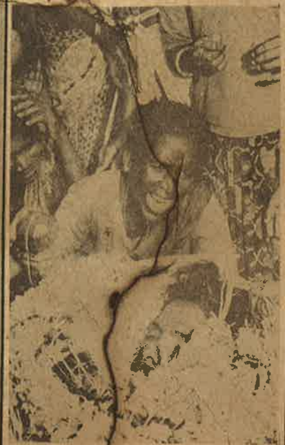
சாதிப் போராட்டத்தில் பலியானவர்

புள்ளையைக் கிள்ளிவிட்டு தொட்டிலை ஆட்டுவது போல வன்னிய சாதிய சங்க தலைமையுடன் கூடக்கூலாவிடக் கொண்டே—மறைமுக ஆதரவு அளித்துக் கொண்டே—வன்னிய—அரிசன சாதிக் கலவரத்தை தடுத்து நிறுத்த ‘வரலாறு காணா சமாதான ஒப்பந்தம்’ போட்டு நாடா மாடுகளை காங்கிரசு.