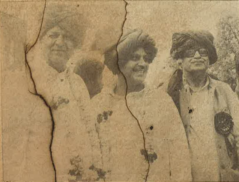
பிற்போக்கு சாதி அரசியல் அடிப்படையில் ஒட்டுப்பொறுக்கத் தீர்மானித்துள்ள ஜனதா தள தலைவர்கள்

ஜாதி அடிப்படையில் திரண்டுள்ள இத்தலைவர்கள், தாழ்த்தப்பட்ட மற்றும் பிற சிறுபான்மை இனத்தவரை மிரட்டி, தாக்கி ஒட்டுச் சாவுகளைக் கைப்பற்றி தேர்தல் வெற்றிகளைச் சாதித்துக் கொள்ளவும் தயங்கமாட்டார்கள். தேவிலால் சஞ்சய்சிங், அஜித்சிங் போன்றவர்களுக்கு ஏற்கனவே இந்த முறை கைவந்த கலையாகும். இப்படிப்பட்ட கட்சியைத்தான் தம்பக்கம் இழுத்துக் கூட்டணி அமைத்துக் கொள்வதற்கு போலிக் கம்யூனிஸ்டுகள் முயற்சிக்கிறார்கள். பாசிச ராஜீவ் அரசின் புதிய பொருளாதாரக் கொள்கையின் மூலவரான வி.பிசிங்கைத் தான் முற்போக்காளராக போலிக் கம்யூனிஸ்டுகள் சித்தரிக்கிறார்கள்.