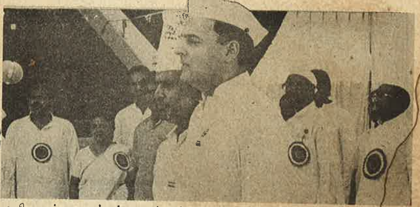
அதிகாரத் தரகர்கள், கட்சியின் கிழகுதட்டிய சமைகள் என்று ராஜீவ் சாடியவர்களை கொண்டு கட்சியை உயிர்ப்பிப்பதாக கூறுகிறார்கள்.

எதிர்க்கட்சிகளில் பெரும் பாலானவை மூன்று அணிகளாக உள்ளன. கேரளம், மேற்குவங்கம், திரிபுரா, ஆகிய மாநிலங்களில் செல்வாக்குடைய போலிக் கம்யூனிஸ்டுகள். மத்தியப் பிரதேசம், ராஜஸ்தான், டெல்லி—இமாச்சலப் பிரதேசம் ஆகியவற்றில் செல்வாக்குடைய பாரதிய ஜனசாகட்சி. இவை இரண்டுக்கும் இடையே