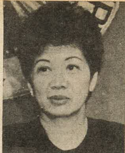
அமெரிக்க அடிவருடி திருமதி அகினோ