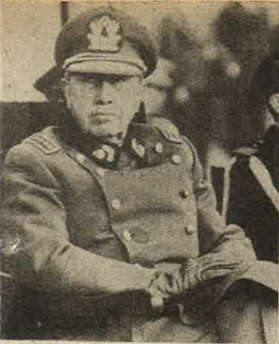
சிவி நாட்டின் நீண்டகால ராணுவ சர்வாதிகாரி பினோசெட்