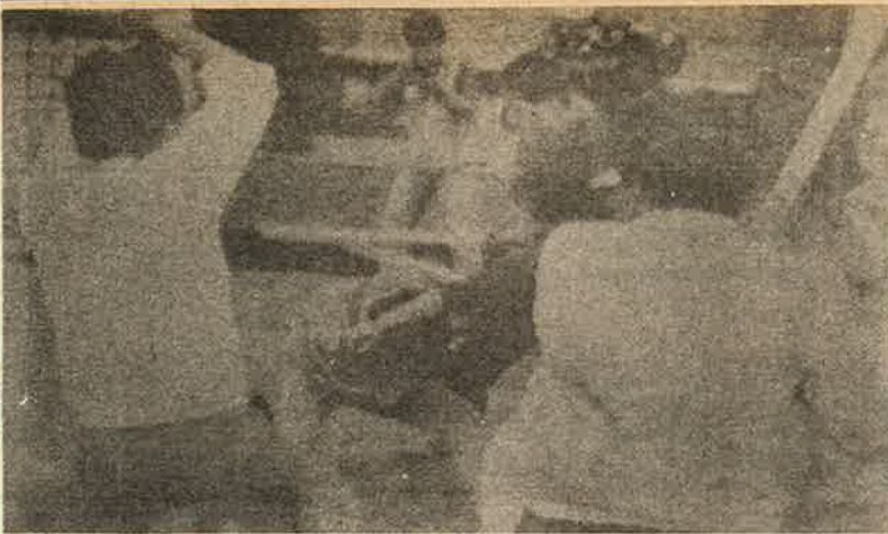
சொந்த நாட்டு மக்களை சுடுகாட்டில் தள்ளிவிட்டு, ஒலிம்பிக் உல்லாசம் காணும் தென்கொரிய சர்வாதிகார அரசுக்கு எதிராக வீதிகளில் மாணவர்கள் வீரப்போர்.

குப்பையில் வீசிவிட்டு கேழ்வரகில் நெய்வடிக்கப் போவதாக மக்களின் வரிப்பணத்தை மலையென விழுங்குகிறது.