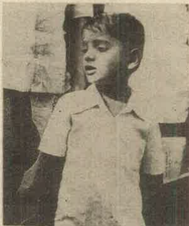
திேசத் துரோக குற்றத்தின் கீழ் கைது செய்து திறைமீடப்பட்ட பாலிவல். குற்றபூங்கு தீவிரவாத லினியின் டிசயல் வீரன்

எல்லாவற்றிலும் கொடுமானது '86 ஆகஸ்டில் கேரளாவில் நடந்தது. அங்கே மலபுரம் மாவட்டம் எஸ்டேட்—பண்ணை முதலாளி ஒருநாள் குடி கூத்தோடு கும்மாளமடிக்க எண்ணினார். அப்பப்பாரா கிராமத்துக்கு பெரிய போலீசு அதிகாரிகள் உட்பட ஒரு போலீசு கும்பலோடு போனார்கள். ஆதிவாசிப் பெண்களை இழுத்து வந்து சாராயம் ஊற்றி, நள்ளிரவில்—நிலவொளியில் நிர்வாணமாக ஆட வைத்து வக்கிரமாக ரசித்ததோடு அவர்களைக் கற்பழித்தனர். தங்கமணி—அப்பப்பாரா—கொடுமைகளை பிரச்சாரம் செய்தே ஆட்சிக்கு வந்த போலீசுக் கும்பலினர்க்கு கட்சிகள் அவற்றின் விசாரணைத் தீர்ப்புகள் வந்தும் குற்றவாளிகளைத் தண்டிக்கவில்லை. இவர்கள் தான் போலீசை