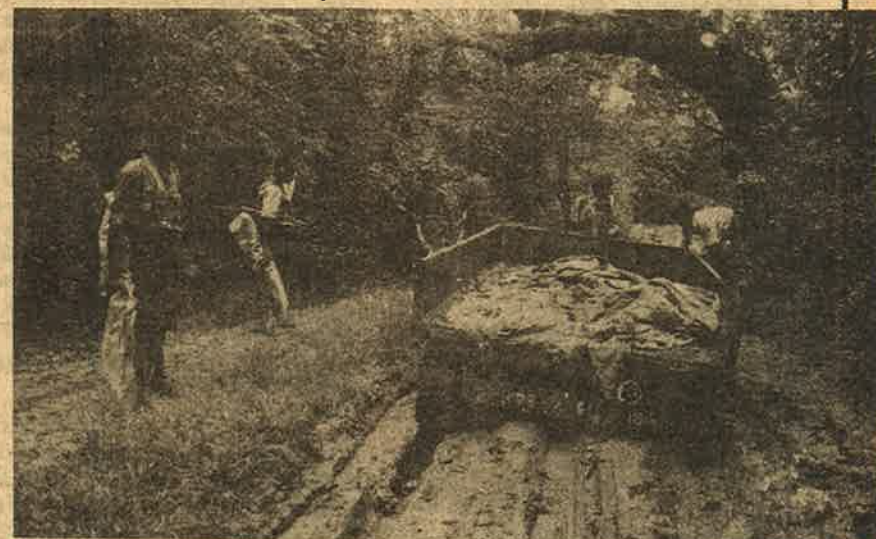
விடுதலைப்புலிகளின் கைப்பிடிக்கப்பட்ட இரத்தம் : கொஞ்சம் அடங்கி !

கொக்குவில், உரும்பிராய் பகுதிகளில் வீடுகள் தரைமட்டம்,