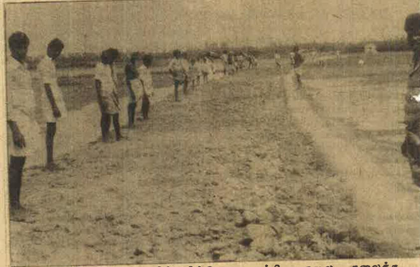
ஒரே நாளில் திட்டமிட்டு உருவாக்கிய சாலை. கலைக்க அனுமதிக்க மாட்டோம் என அணிவகுத்து மனிதச் சங்கிலியாய் நிற்கும் கானத்தூர் மக்கள்.

இவர்களின் எந்த ஒரு சிறு தேவைக்கும் நான்கு கிலோ மீட்டர் தொலைவிலுள்ள கூவத்தூர் என்ற கிராமத்திற்குதான் செல்ல வேண்