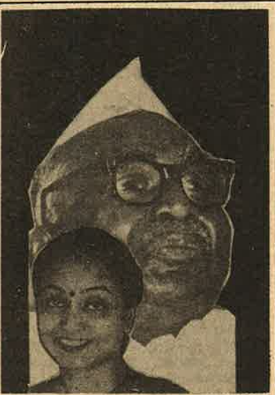
ஜனநாயகம், பதவி சுகம் அனுபவித்த பிறகு மீண்டும் இந்திராவிடமே சரணடைந்தார். ராஜீவிடம் கெஞ்சி தனது மகன்பீரா குமாருக்கு எம்.பி பதவி பெற்றார். ஜெகஜீவன்

ஷேக் அப்துல்லாவின் மனைவி பேகம் அக்பர் ஜகான் கணவனுக்