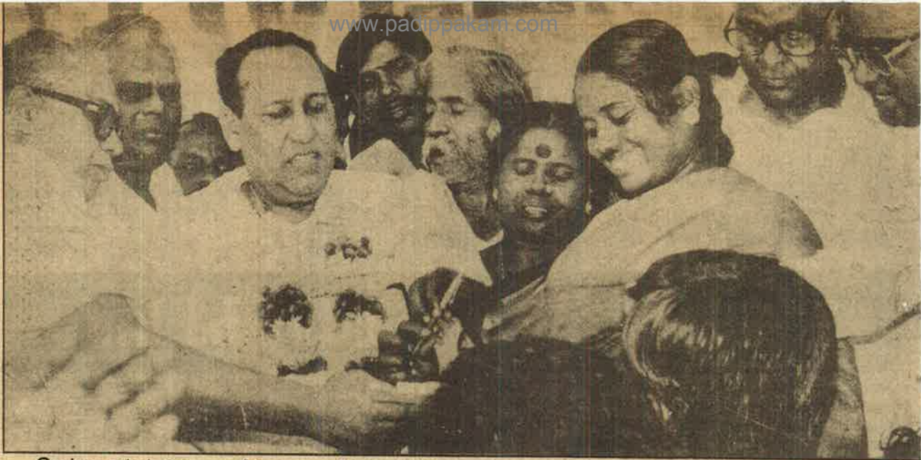
இலங்கை ஒப்பந்தத்தை ஆதரித்து மதுரையில் இ.காங்கிரஸ் கையெழுத்து வேட்டை தொடங்கிய போது எடுத்த படம். சாக்கடையாகநாறும் ராஜீவின் —இலங்கை ஒப்பந்தத்தையும், அமைதிப் படையையும் பாராட்ட இந்த கழிசடைகள் தேடி ஓடி இருப்பதில் வியப்பேதும் இல்லை.

தெரியாத ஒரு பெண்ணிடம் இருட்டில் பலமணி நேரம் வக்கிரமாக நடந்து கொண்டு, இதை “ஒரு இலக்கியவாதியின் அனுபவங்கள்” என்று வெட்கமில்லாமல் எழுதி பணம் பண்ணிய ஜெயகாந்தன் அளவுக்கு “நாகரீகம்” வளராத வனுக்கும் இந்திய—இலங்கை ஒப்பந்தத்தின் ‘உண்மை’ தெரிய வாய்ப்பு இல்லைதான்.