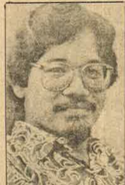
தொழிலாளர் உரிமைக் கா கப் போராடிய டாக்டர் முகம்மது நசீர்