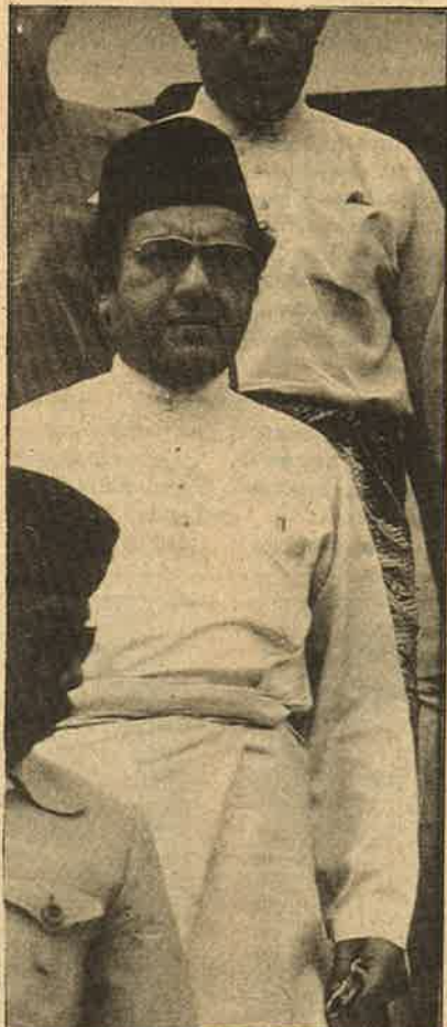
மலேசியாவின் பாசிசப் பிரதமர் மகாதீர்

இ ந்தியாவின் தென்கிழக்கேயுள்ள மலேசியா வீரம் செறிந்த ஏகாதிபத்திய எதிர்ப்புப் பாரம்பரியத்தைக் கொண்டது. ஆங்கிலேய ஏகாதிபத்தியத்தின் காலனியாதிக்கத்தை எதிர்த்துக் கொண்டு கிடந்த மலேசிய மக்கள், கம்யூனிஸ்டுகளின் தலைமையில் மக்கள் படை