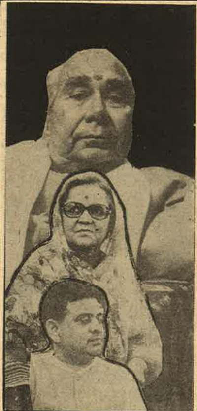
கமலாபதி திரிபாதிமகன் லோகபதி திரிபாதியை உத்திரப் பிரதேச முதல்வராக்கி விட முயலுகிறார். ஏற்கனவே லோகபதி திரிபாதி உத்திரப் பிரதேச சுகாதார மந்திரியாக உள்ளார். அவரது மனைவி சந்திரா திரிபாதி எம்.பி. ஆக உள்ளார்.

கமலாபதி திரிபாதியைப் பார்ப்பனர்களும், வி.பி சிங்கை ராஜபுத்திரர்களும் தமது தலைவர்களாக வைத்து இந்த அதிகாரப் போட்டியில் ஈடுபட்டுள்ளனர். எனினும் இவ்விருவரும் அதை மறுக்கின்றனர் — மறைக்கின்றனர். கமலாபதி திரிபாதி உத்திரப் பிரதேச அரசியலில் தனது குடும்பத்தின் செல்வாக்கை உறுதி செய்து தனது மகன் லோகபதி திரிபாதியை முதல்வராக்கி விடவும், தேச அளவில் பார்ப்பனர்களின் கூட்டினரிடம் உருவாக்கவும் முயலுகிறார். கர்நாடகா குண்டுராவ், மேற்கு வங்க பிரவை முகர்ஜி, மத்திய பிரதேச சுக்லா, பீகாரின் ஜகநாதமிஸ்ரா ஆகியோரைக் கொண்டு ஒரு குடும்ப பல உருவாக்க முயன்றதில் அவர்கள் தோற்றுப் போனார்கள். இருந்தாலும் நம்பிக்கையைக் கைவிடவில்லை. இந்திரா விசுவாசிகள் என்றும் முத்திரையோடு ராஜீவ் குடும்பின் ஒரு “நிர்ப்பந்தக் குழுவாக” தங்களை உறுதிப்படுத்திக் கொள்ள இப்பொழுது முயலுகிறார்கள்.