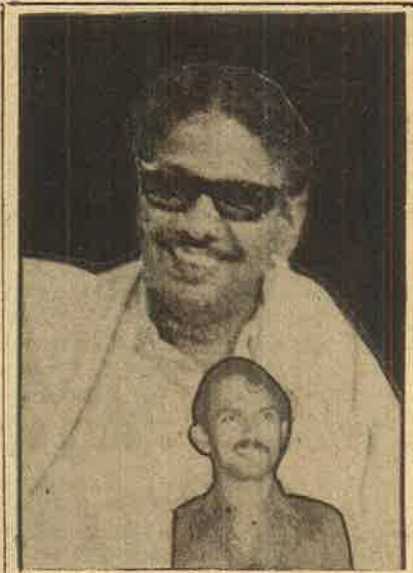
ஜனநாயகம் பேசும் கருணாநிதி தமது மகன்களை அரசியல் வாரிசாக்குவதற்குத் தொடர்ந்து முயலுகிறார்.

இந்தத் தொழிலுக்கு வருவதற்கு முன்பு ஏதாவது பெருகான உற்பத்தி செய்தோ விற்றோ லாபம் சம்பாதித்தார்கள். இந்தத் தொழிலுக்கு வந்த பிறகு அம்மாதிரியான உற்பத்தி அல்லது வியாபாரத்துக்