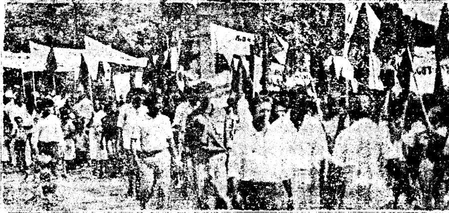
குருமனகாட்டிலிருந்து வவுனியா நகரப்பகுதியை நோக்கி அலைஅலையாய் அணி அணியாய்.....

தமிழீழ மக்கள் விடுதலைக் கழகமும் அதன் அரசியற் பிரிவான ஜனநாயக மக்கள் விடுதலை முன்னணியும் உழைக்கும் மக்களின் பேராதரவுடன் நடாத்திய மேதின விழாவானது வரலாற்று முக்கியத்துவம் வாய்ந்த ஒரு நிகழ்வாக காணப்பட்டமை அரசியல் அவதானிகள் அனைவரையும் பிரமிக்கச்செய்துள்ளது.