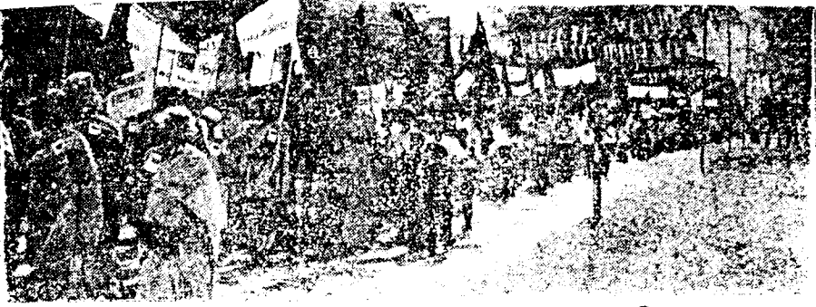
சமூக விடுதலை என்பது பெண்விடுதலையுடன் கூடியதே என பேரிகை முழக்கும் பெண்கள் படை.....

இதற்கு ஒரு மைல் கல்லாக அமைந்ததே வவுனியாமாவட்ட மக்களின் மேதினப்பேரணியாகும். இப் பேரணியானது ஆயுதக் கலாச்சாரத்தை அறவே வெறுத்து நிரந்தர அமைதிக்காகவும் ஐக்கியத்துக்காகவும் ஒலிக்கும் குரலாகவும், கடந்த கால யுத்த அழிவுகளிலிருந்தும், அனர்த்தங்களிலிருந்தும் மீளமுடியாது பரிதவிக்கும் ஏழை விவசாய, தொழிலாள, மக்களின் ஏக்கப் பெருமூச்சுக்களின் வெளிப்பாடாகவும், எதிர்வரும் காலங்களில் போரினைத் தவிர்த்து எதிர்கால சந்ததியினரின் கல்வியறிவைப் பெருக்குவதிலும், அழிந்து போகும் புத்திஜீவிகளின் கல்விச் சூழலைப் புனரமைப்பதிலும் அக்கறை கொண்ட ஆசிரியர், மாணவர்களின் ஆதங்கத்தையும் வெளிப்படுத்தியதை அவதானிக்க முடிந்தது.