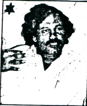
பேரிதேவாலி கண்டனர் சின்னச் சின்ன ரஜகைகளை அறிவித்து ஆட்சியாளர்கள் எங்களை ஏமாற்றி வந்தனர் முகத்தில் எங்கள் மொழியில் கைவைத்தனர்