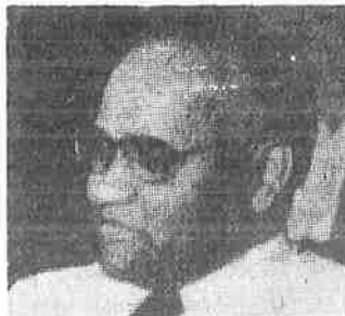
Mr Amirthalingam: Tamils 'will fight to the bitter end'.

The congress's executive committee adopted a resolution saying that the Government's refusal to negotiate with Tamil representatives raised fears that it no longer wanted a political settlement but was trying to impose its will by military force.