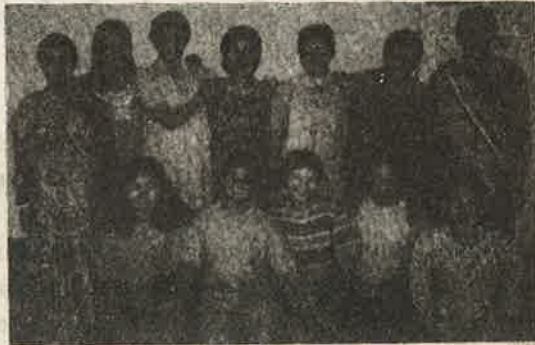
பல்வேறு பாதுகாப்பு சட்டங்களின் கீழ் கைது செய்யப்பட்ட பெண்கள்

மேற்சொன்ன நிகழ்ச்சிகளைத் தவிர கூட்டம் கூட்டமாகப் பெண்களை வன்புணர்ச்சி செய்வது, ஹெலிகாப்டர் மூலம் பெண்களைக் கடத்தி வேறு இடத்திற்கு கொண்டு சென்று வன்புணர்ச்சி செய்து கொலை செய்வது போன்றவை புரட்சிகர