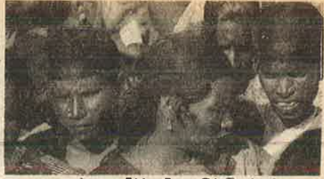
சாராயத்தை எதிர்த்து போராடும் பெண்கள்