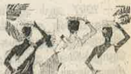
உடுத்த ஆடையில்லை ஆனால் கம்ப்யூட்டர்!

இது மட்டுமல்லாமல், வளர்ந்துவரும் தொழில்நுட்பம் மற்றும் அறிவியல் வளர்ச்சியும் பெண்களை வணிகமயமாக்குவதை துரிதப்படுத்துகின்றது.