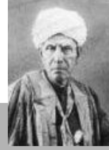
உ. வே. சா

நகரம் என்பது எல்லத்தரப்பினருக்குமானதாக இருக்கவேண்டும். (எடுத்துக்காட்டாக சமப்பாலுறவாளர்கள், சிறுபான்மையினருக்கு நட்பாக இருத்தல்) எல்லோரையும் கவரக் கூடியதாக இருக்கவேண்டும். நகரம் என்பது எல்லாவிதத்திலும் பாதுகாப்பானதாக இருக்கவேண்டும்.