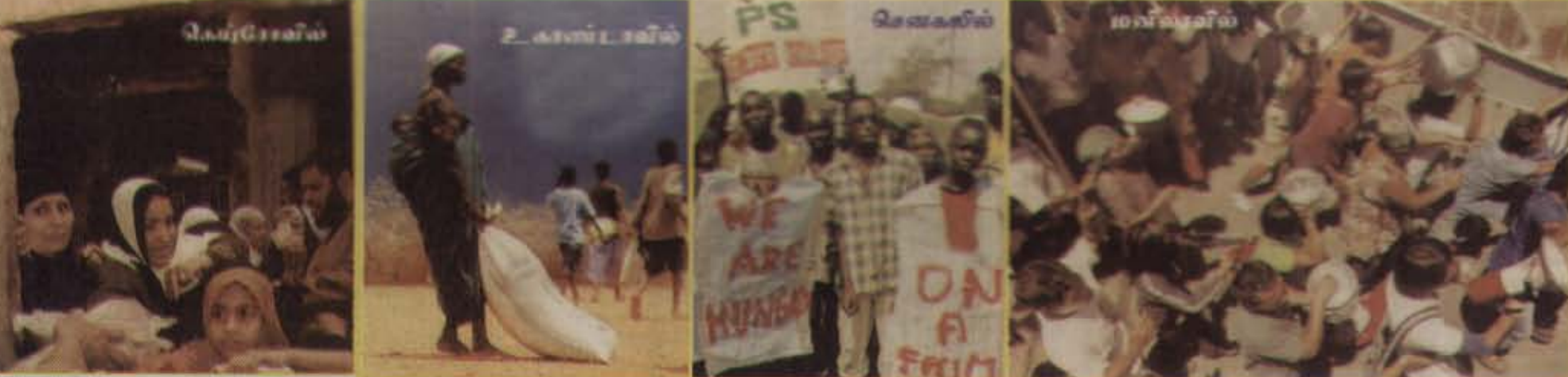
முன்னரம் உலக நாடுகளில் அரிசிக்கும் உணவுக்கும் அல்லாடும் மக்களும் எதிர்ப்புப் போராட்டங்களும்