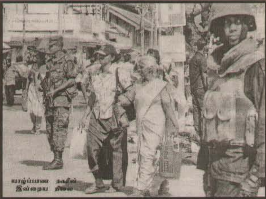
வாழ்ப்பாணம் நவீன இயல்பு நிலை

கயிறு திரிக்கப்பட்டவாறான ஒரு வாழ்வாகவே காணப்படுகிறது. இவற்றுக்கும் மத்தியில் மக்கள் தமது கருமங்களை வெவ்வேறு அளவுகளிலும் தேவைகளின் காரணமாகவும் செய்தே வருகிறார்கள். அவை மனித இயல்பிற்கும் இருப்பிற்கும் உரியவையாகும். சமூக வாழ்வில் வரும் நிகழ்வுகள் யாவும் பெரிய சிறிய அளவில் இடம் பெறுகின்றன. ஆனால் அவை இயல்பு வாழ்க்கைக்குரிய உதாரணங்கள் ஆகிவிட்டிருக்கிறது. இத்தகைய பொது நிகழ்வுகள் திருவிழாக்கள் எனப்படும் இடப்பாடுகள் துன்பங்கள் மத்தியில் வாழ்ந்து வரும் மக்களுக்கு சிறு ஆறுதல் தரும் நிகழ்வுகளாகவே அமைந்து கொள்கின்றன. வடக்கின் இந்த நிலை போன்று ஆனால் வேறுபட்ட சூழலில் கிழக்கின் மக்கள் துன்புறுப்புகளை அனுபவித்து வருகின்றனர். கடந்த மூன்று தசாப்தங்களிலான வடக்கு கிழக்கின் மக்களது வாழ்வும் இருபடி துயரங்களின் நடுவில் அகப்பட்டதாகவே இருந்து வருகின்றது. இத்தகைய நிலைக்கு முடிவு வேண்டும். உண்மையான இயல்புவாழ்வாக்கான சமாரானம் மலர் வேண்டும் அதற்குரிய அரசியல் தீர்வு காணப்பட வேண்டும் என்பதே மக்களின் ஆழ்மன