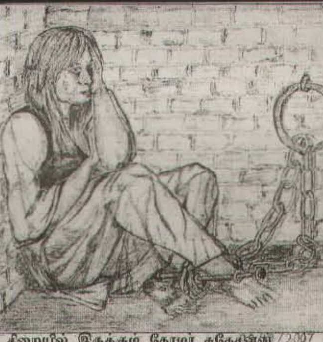
சீனாவில் இருக்கும் தோழர் ககேக்ஸ்ஸ் / 2007 வரைந்த ஓவியம் 10:17 P1

என்று கொள்வதுமில்லை எதையும் முடிந்த முடிவாக்கி முற்றுப்புள்ளி வைப்பதில்லை. ஆணாதிக்கச் சமுதாயத்திலிருந்து வரும் இரு பாலருக்கும் ஆணாதிக்கச் சிந்தனையின பாதிய்புணர். அதிலிருந்து விடுதலை பெறுவது சமூக விடுதலைக்கு அவசியமானது. எனவே கம்யூனிஸ்ட்டுக்கள் தேசியவாத கரண்டும் வர்க்க சாதிய, ஆணாதிக்கச் சிந்தனைக் கூடகெல்லாம எதிரான போராட்டங்களைத் தமது கட்சிகளுக்கு வெளியேமட்டுமன்றி உள்ளேயும் நடத்த வேண்டியவர்களாக உள்ளனர். அவ்வாறு தொடர்ச்சியாக நடத்துவதன் மூலமே