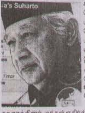
சுகாட்டோவின் மக்கள் எதிர்த்த போது அமெரிக்கா சுகாட்டோவிற்கு பல்லாயிரம் டொலர்கள் கடன் கொடுத்தும் பாதுகாத்தது. இவனது ஆட்சிக் காலத்தில் தேசிய இனங்கள் மீது ஒடுக்கு முறைகள் அதிகரித்தன. கிழக்கு தீமோர் ஆக்கிரமிக்கப்பட்டது. அச்சே பிரதேசத்தின் விடுதலை வேண்டிய மக்கள் எழுச்சிகளை ஒடுக்கப்பட்டன.

அண்மையில் இந்தோனியாவின் முன்னாள் ஊனாதிபதி சுகாட்டோ தலை நகர் ஜகார்த்தாவில் காலமானான். 32 வருட ராணுவ சர்வாதிகாரத்தையும் மோசமான ஊழலையும் முன்னெடுத்த சுகாட்டோ அமெரிக்க அடிவருடியும் விகவாசியுமாவான். இந்தோனேசியா இருபது கோடி மக்களைக் கொண்ட நாடு. சுமார் 17, 000 தீவகளை உள்ளடக்கிய அந்நாட்டின் நீளம் 3500 மைல்களாகும். 300 இனங்களும் 250 மொழிகள் பேசும் மக்கள் அந்நாட்டில் வாழ்கின்றனர். டச்சுக் கொலனித்துவவாதிகளிடமிருந்து நாட்டை மீட்டுவதெடுத்த இந்தோனேசிய மக்கள் தமது முதலாவது தேசியத் தலைவராக டாக்டர் சுகர்ணோவை முதலாவது ஊனாதிபதியாகத் தேர்ந்தெடுத்தனர். நாட்டுப்பற்றும் மக்கள் சார்பும் ஏகாதிபத்திய எதிர்ப்பும் சுய சார்பும் பொருளாதாரக் கொள்கையும் கொண்ட சுகர்ணோ அந்நாட்டின் பலம் மிக்க கம்ப்ளினிட் கட்சியை நட்பு சக்தியாக்கி ஆட்சி நாடாத்தினார். அவரது அமைச்சரவையில் ஐந்து கம்ப்ளினிட் தலைவர்கள் அமைச்சர்களாக இருந்தனர். தொழிலாளர் விவசாயிகளின் வாழ்க்கை மாற்றத்திற்கு சுகர்ணோவின் ஆட்சியில் அங்கம் பெற்று சாதிக்கலாம் என நம்பிக்கை வைத்தே கம்ப்ளினிட்க்கள் செயலாற்றினர். ஆனால் முதலாளித்துவமும் ஏகாதிபத்தியமும் வழமை போன்று ஆட்சிக் கவிழ்ப்பைச் செய்து ராணுவச் சதியை நிறைவேற்றியது. ராணுவ உயர் அதிகாரிகளை இரகசியமாக அணிதிரட்டிய அமெரிக்காவும் சி.ஐ.ஏ.யும் சுகாட்டோவைப் பயன்படுத்தியது.