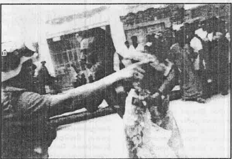
அமெரிக்க ஆக்கிரமிப்பாளனே ஈராகை விட்டு வெளியேறு என ஒரு ஈராகிய பிரஜை அமெரிக்க சிப்பாயை நோக்கி ஆக்ரோஷத்துடன் கூறுகிறார்.

உலகத்தையே பலமுறை அழிக்குமளவு ஆயுத பலம் கொண்ட அமெரிக்க வல்லரசு, ஏற்கனவே ஒருமுறை உலகத்தை அழிக்கக் செய்து அழித்த அனுபவம் கொண்ட பிரிட்டிஷ் வல்லரசு, அவர்களுடைய 3 லட்சம் துருப்புகள், 20,000 டன் வெடி மருந்துகள், இலக்குகளைக் குறி வைத்துத் தாக்கும்