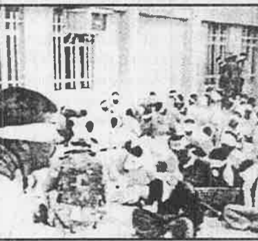
பக்தாத் நகரில் அமெரிக்கா ஆக்கிரமிப்பு படையினரால் ஈராக்கிய இளைஞர்கள் கண்கள் கட்டப்பட்டு தும்பாக்கி முனையில் சோதனைக்குட்படுத்தப்படுகிறார்கள்.

இந்த மாபெரும் போரில், உலகின் மாபெரும் இராணுவத்தின் மாவீரர்கள்