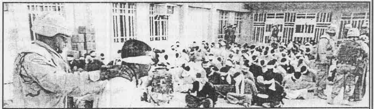
பக்தாத் நகரில் அமெரிக்கா ஆக்கிரமிப்பு படையினரால் ஈராக்கிய இளைஞர்கள் கண்கள் கட்டப்பட்டு தும்பாக்கி முனையில் சோதனைக்குட்படுத்தப்படுகிறார்கள்.

நிகழ்வைக் குறிக்கும் சொல். இராக்கைப் பதின்மூன்று ஆண்டுகள் பட்டினி போட்டு, சூழ்ச்சியால் ஆயுதப் களைப் பறித்து அமெரிக்கா நடத்தியிருக்கும் இந்த கிருஷ்ண பரமாத்மா வேலைக்கு வேண்டுமென்றால் வேறு பெயரிடலாம்; நிச்சயம் இது போர் அல்ல. மிதிபட்டு நைந்துபோன இராக்கின் மிதந்தன், பீரங்கிக் குழாயின் முன் நிமிர்ந்து நின்று "அமெரிக்காவே வெளியேறு" என்று முழங்குகிறானே, இதுதான் போர். இந்தப் போர் இன்னும் முடியவில்லை.