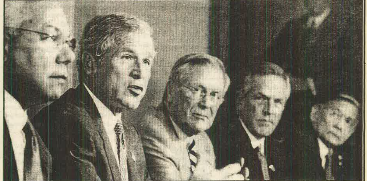
ஈராக்கில் இரத்தம் குடிக்க நிற்கும் அமெரிக்க ஆளும் வர்க்க ஓநாய்கள்

அமெரிக்காவின் பக்கம் உள்ளனர். ஐ.நா.வைக் கூட முழுமையாக அமெரிக்காவால் வளைத்து நிற்க முடியவில்லை. இந்நிலையில் எய்டியும் ஈராக் மீது போர் தொடுப்பதை அமெரிக்கா உறுதிப்படுத்தி நிற்கிறது. உலக மக்களும் நாடுகளும் அமெரிக்காவின் வெறித்தனமான போர்த் தொடுப்பைக் கடுமையாக எதிர்த்து வருகிறார்கள். நமது நாட்டு அமெரிக்க அடிவருடியாக நிற்கும் யூ.என்.பி. ஆட்சி ஈராக் மீது போர் தொடுக்காதே என்று உறுதிப்படுத்தி கூறிக் கொள்ள அஞ்சி அடங்கி இருக்கிறதும் கேவலத்தையே காண முடிகின்றது. எனவே மக்கள் அனைவரும் அமெரிக்காவின் ஈராக் மீதான போரைக் கைவிடும்படி வற்புறுத்துவதை மேலும் விரிவுபடுத்த வேண்டும்.