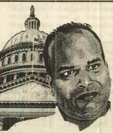
கூறியிருப்பது இதுதான் முதற்தடவை என்று கூறுவதில் பிழையிருக்காது.

சில காலத்திற்கு முன்பு ஹவாயில் நடைபெற்ற கூட்டமொன்றில் உரையாற்றும் போது உலக நாடுகளுக்கு கேள்விக் குப்படுத்தப்படாத மேலாதிக்க தலைமையாக அமெரிக்கா விளங்குவதை அவர் வரவேற்பதாக தெரிவித்திருந்தார்.