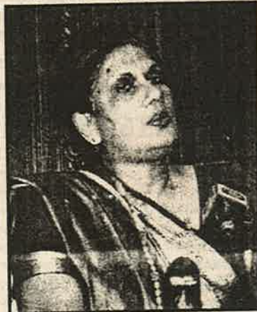
உலக நாடுகளிடம் பிச்சா பாத்திரத்தை கூச்சமின்றி நீட்டிக் கொள்ளவும் முடிகிறது. உலக வங்கி சர்வதேச நாணய நிதியும், ஆசிய அபிவிருத்தி வங்கி என்பன தமது உள்நோக்கங்களை நிறைவேற்ற நிதி வழங்கத் தயார் எனவும் கூறி நிற்கின்றன.

அதேவேளை அரசாங்கம் தன்னைச் சமாதானத்தின் தூதுவராகக் காட்டி