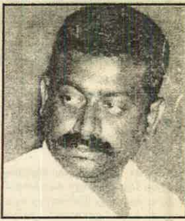
இ.தொ.கா.வை திருத்தியமைக்க முற்படுவதாக கூறியவர்கள் ம.மு.யை அமைத்து இன்னுமொரு இ.தொ.கா.வாக மாற்றியுள்ளனர். அதனால் இ.தொ.கா.வும் ம.மு.யும் மலையகத் தமிழ் மக்களுக்கு ஒரே மாதிரியான அமைப்புகள்தான். அதனால் ம.மு.யும் அதனது பலத்தை நிலைநாட்ட இன்னுமொரு மாநாட்டை பெரும்பெரும் விழாபடைவிலான புரட்சிகர அமைத் தோட்டத் தொழிலாளர் வர்க்கத்திற்கும், அடக்கப்படும் மலையகத் தமிழ் தேசிய இனத்துக்கும் எவ்வித நன்மையும் ஏற்படப் போவதில்லை.

தோட்டத் தொழிலாளர்களினதும், மலையகத் தமிழ் மக்களினதும் பெரிய அமைப்பு என்று சொல்லப்படுகின்ற இ.தொ.கா.வின் மாநாடு அம்மக்களின் அரசியல் அபிலாஷைகளை ஓரளவாவது பிரதிபலித்ததா என்பதுதான் கேள்வி. தோட்டக் கம்பெனிகளின் மிதமிஞ்சிய சுரண்டலுக்குள்ளாகப்பட்டு, உரிய சம்பளமின்றி, வேலையளவு கூட்டப்பட்ட நிலையில் தோட்டத் தொழிலாளர்கள் கஷ்டப்படுகின்றனர். ஏற்கனவே உறுதி செய்யப்பட்டிருந்த உரிமைகளை ஒவ்வொன்றாக நடைமுறையில் தோட்டக் கம்பெனிகள் பறித்து வருகின்றன. தொழிற்சட்டங்களுக்கு திருத்தம் கொண்டு வரப்பட்டு ஒவ்வொரு உரிமையாக மறுக்கப்பட்டு வருகின்றது.