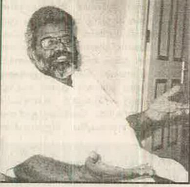
கேள்வி : உங்களது எழுத்துலகப் பிரவேசம் பற்றிக் கூற முடியுமா?

பதில் : நான் தோட்டத்தில் பிறந்தவன். தோட்டத்தில் வேலை செய்தவன் என்ற வகையில் அங்கு வாழும் மக்கள் படும் வேதனைகளையும் துன்பங்களையும் அனுபவித்துள்ளேன். தோட்டப் பகுதியில் வாழும் இந்தியத் தமிழர் களின் சமூகப் பிரச்சினைகள் எண்ணிக் கையற்றவை. ஆங்கிலேயரால் எமது மக்கள் மலேசியாவுக்கு இழுத்து வரப் பட்ட காலம் முதல் இன்று வரை உழைப்பைத் தவிர வேறொன்றையும் அறியாதவராய் வாழ்ந்து மடிந்தனர். இன்றும் வாழ்ந்துக் கொண்டிருக்கின்றனர். நபர் தோட்டங்களையும், செம்பனைத் தோட்டங்களையும் உருவாக்கிய மக்கள் கூட்டத்தினரின் உழைவை குறிப்பாக அவர்களது வரலாற்றைப் பதிவு செய்ய வேண்டும் என்ற எண்ணமே என்னை எழுத்தத் தூண்டியது.