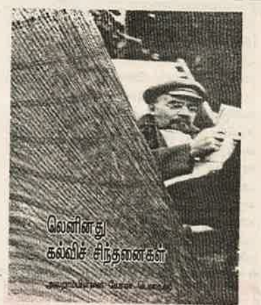
வெள்ளினது கல்விச் சிந்தனைகள்