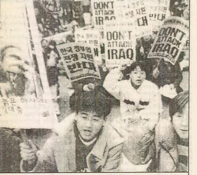
தென்கொரிய தலைநகர் சியோலில் ஈராக் மீது போர் தொடுக்க வேண்டாம் என அமெரிக்காவை எதிர்த்து மக்கள் கோபாவேசத்துடன் ஆர்ப்பாட்டம் செய்தனர்

ஆப்கானிஸ்தான், ஈராக், ஈராக்கில் நடந்து வரும் சதாம் உசேன் ஆட்சியைக் கவிழ்ப்பதற்கு, கடந்த பத்தாண்டுகளாகவே அமெரிக்கா முயன்று வருகிறது.