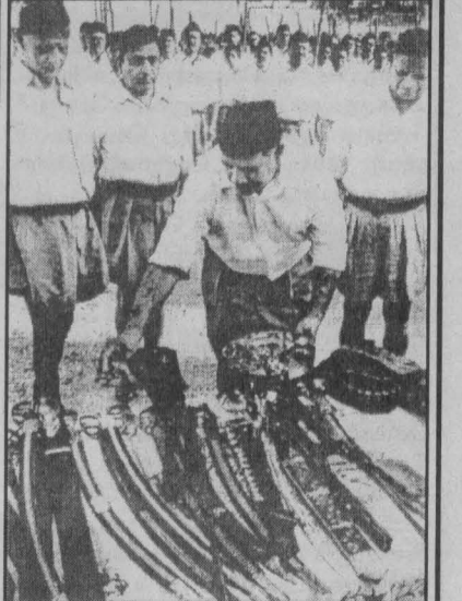
கொலைக்கருவிகளான துப்பாக்கிகள், வீச்சரிவாளர், பட்டாக்கத்திக்கு "ஆயுத பூசை" நடத்துகிறார்கள் ஆர்.எஸ்.எஸ். இந்து மதவெறியர்கள். இவர்கள் பயங்கரவாதிகள் இல்லையா?

ஆனால், இந்த அமைப்புகள், தாம் உண்மையில் பாசிச பயங்கரவாதிகள் என்பதைத் திரும்பத் திரும்ப நிரூபித்து