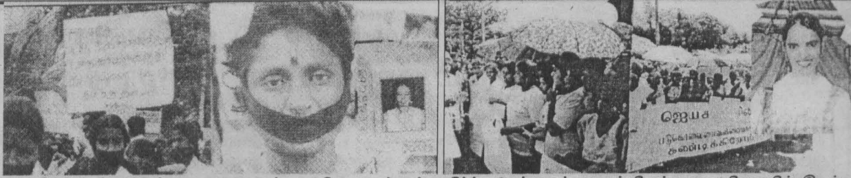
பாலியல் வல்லுறவுக் கொலைகளுக்கு எதிராக மக்கள் எதிர்ப்பு உயர்வலம் நடாத்தினர். வவுனியாவில் இடம் வற்றதை முதலாவது படத்திலும் கிரத்தினபுரியில் இடம் வற்றதை இரண்டாம் படத்திலும் காணலாம்.