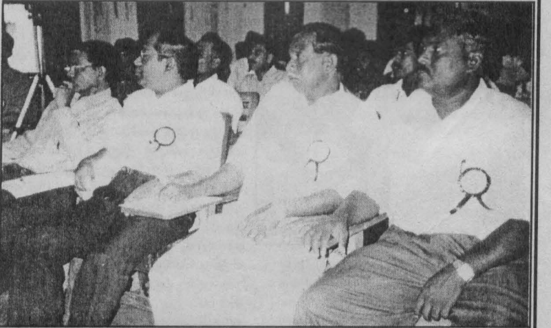
மாநாட்டுப் பிரதிநிதிகளில் ஒரு பகுதியினரை திகிலே காணலாம்.

இத்தகைய முதலாளித்துவ பாராளுமன்ற ஆட்சி அமைப்பு முறை காலத்திற்குக் காலம் அரசமைப்பு மாற்றங்கள்,