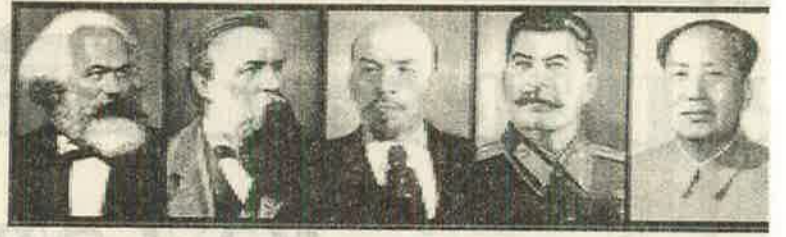
மாக்ஸியத்தின் போதாமையின் பற்றி

அண்மையில் கிழக்கு மாகாணத்தின் மூதூரில் ஆரம்பித்து அம்பாறை வரை மோசமாக விசிய இன வன்முறைச் சூறாவளி மீண்டும் ஒருமுறை தமிழ் முஸ்லீம் உறவில் மிளவை உண்டாக்கியிருக்கிறது. உயிர் குடிப்பும், ரத்தம் சிந்தலும், கடைகள் வீடுகள் எரிப்பும், உடமைகள் அழிப்பும் இரு பக்கத்திலும் இடம்பெற்றிருக்கின்றன. இவை திட்டமிடப்பட்டவையா? அல்லது தற்செயலானவையா? அறுதியிட்டுக் கூற முடியாதவிடமும் நிச்சயம் இந்த தமிழ் முஸ்லீம் இன வன்முறைச் சூறாவளிக்குப் பின்னால் மறைமுகங்களும் கரங்களும் இருந்துள்ளன என்பது மட்டும் உண்மை. காலாகாலத்தில் அவற்றின் உண்மை வெளிவரவே செய்யும்.