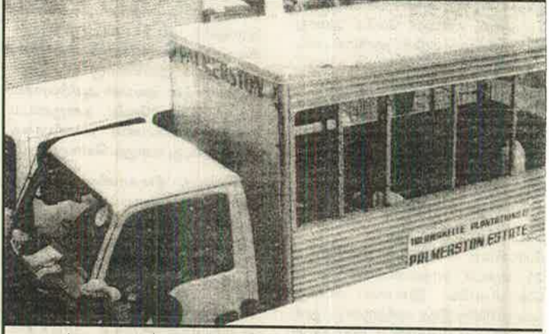
கருத்தடை சத்திரசிகிச்சையின் பின் மயக்கமுற்ற நிலையில் வாகனத்தில் ஏற்றிச் செல்லப்பட்ட காட்சி

படவில்லையாம். காரணம் கருத்தடை சத்திரசிகிச்சை காரணமாக சில தோட்டங்களில் சில வருடங்களாக பிள்ளைகளை பிறக்கவில்லையாம். திட்டமிட்ட கருத்தடையினால் மலையகத் தமிழ் மக்களின் குடிசை வளர்ச்சி வீதம் பாதிக்கப்படுகிறது. அத்துடன் அவர்களின் சுயகொளவும் பாதிக்கப்படுகிறது. இதனால் சமூக ரீதியான பாதிப்புகள் ஏற்படுவதுடன் தனிப்பட்ட பெண்கள் பாதிப்புக்குள்ளாகின்றனர். கருத்தடை சத்திரசிகிச்சை செய்து கொண்டவர்களுக்கு மாநாந்தம் அதிக குருதி வெளியேறுவதால்