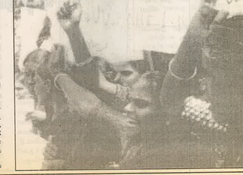
தொடர்ச்சி 12ம் பக்கம்