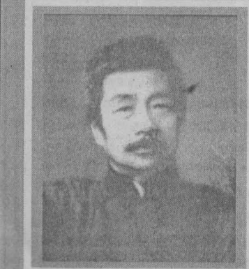
தமிழாக்கம் க. நடசபாபதி