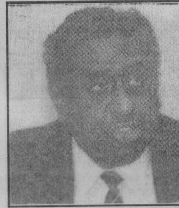
பதவிக்காக ஜே.வி.பிக்குப் பின்னால் அலைகிற ஒரு 'இடது சாரியாரால்' புதிய இடதுசாரி முன்னணியின் நேர்மையான கட்சிகளை விட அவருக்கு நெருக்கமாக இருக்க

அவருடைய அரசியல் நேர்மையும் தைரியமும் தயக்கமற்ற செயற்பாடும் அவருடைய வலிமைகள். அதே வேளை ஒரு தனி மனிதராகச் செயற்படுவதன் விளைவான அகச்சார்பான அரசியல் நோக்கும் தனிமனித முரண்பாடுகளுக்கு அளிக்கப்படும் மிகையான முக்கியத்துவமும் அவருடைய அரசியற் பலவீனங்கள். தமிழ்த் தேசிய இனத்தின் மீதான ஒடுக்குமுறை மீது குவிக்கப்பட்ட அவரது கவனம் அந்த