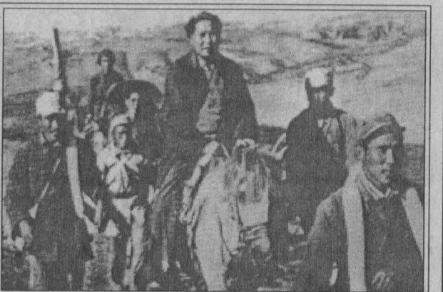
நீண்டபடை நடப்பின் போது விடுதலைப் படையுடன் மா.ஓ

சீனாவின் அயற் கொள்கை பற்றி நாம் கவனிக்க வேண்டிய முக்கியமான சில விடயங்கள் உள்ளன. நாடுகளிடையே பஞ்ச சீலம் என்ற, சமத்துவ அடிப்படையிலான உறவு சீனாவால் உறுதியாகக் கடைப்பிடிக்கப்பட்டுவந்துள்ளது. பிற நாடுகளின் உள் விவகாரங்களில் குறுக்கிடாமை நாட்டின் அளவு, சனத்தொகை, வலிமை போன்றவற்றைக் கணிப்பில் எடாத சமத்துவம் என்பன சீனாவின் அந்திய உதவியிலும் காணப்பட்ட ஒரு முக்கிய பண்பாகும். உதவி பெறும் நாட்டின் தேவைகளை மதித்து நடப்பது பற்றிய சீன அரசின் கொள்கை சீன நிபுணர்கள் உட்பட அயல் உதவி ஊழியர்களாலும் கடைப்பிடிக்கப்பட்டது. போகும் நாட்டின் வாழ்க்கைமுறைக்கும் வாழ்க்கைத் தரத்திற்கும் ஏற்ப வாழ்வதும் எளிமையும் அனைத்தையும் வெளிவெளியாகக் கலந்து பேசுவதும் மிகவும் முக்கியமாகக் கடைப்பிடிக்கப்பட்டன. இதனாலேயே சீன உதவியும் சீன நிபுணர்களும் கியூபா தவிர்ந்த பிற நாட்டு உதவியினின்றும் நிபுணர்களினின்றும் வேறுபட்டோராகக் காணப்பட்டனர்.