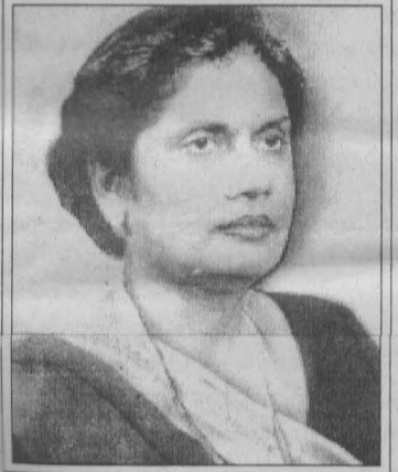
மேலும் பல வருடங்களுக்கு யுத்தம் நீடிக்கப்படுவதுடன் மற்றொரு கோசுவோவாக நாடு மாறி விடவே செய்யும்.

யுத்தம் வெற்றி பெறுவதற்கு இதுவரை வருடாவருடம் கொடுக்கப்பட்டு வந்த காலக் கெடுக்கள் (தொடர்ச்சி 3ம் பக்கம்)