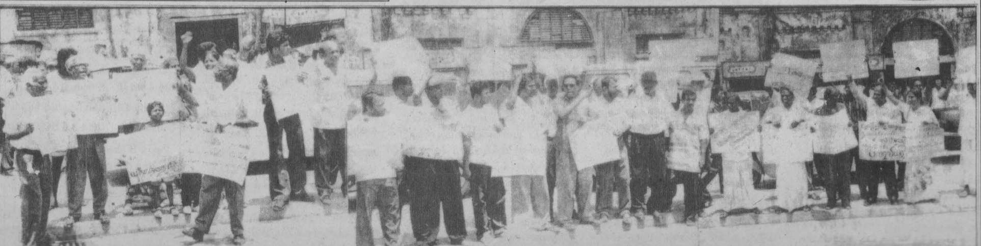
மார்ச் 24ம் திகதி வெள்ளாவத்தை சந்தை வளாகத்தில் வலிவடக்கில் 12ஆயிரம் ஏக்கர் நிலம் ராணுவப் பறிப்புக்கு உள்ளாகுவதை எதிர்த்து புதிய இடதுசாரி முன்னணி நடாத்திய ஆர்ப்பாட்ட மறியல் போராட்டம்.