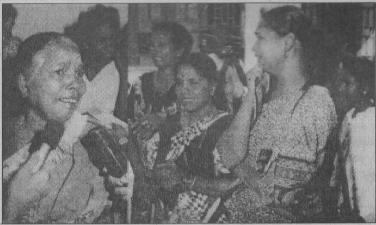
வடக்கில் காணாமல் போனோரின் தாய் மாறும் மனைவிமாறும் கதறி அழும் காட்சி.

நிரப்பப்பட்ட நிலப்பகுதிகளைக் கொண்ட புதைகுழிப் பிரதேசமாகவே காணப்படுகின்றன. இதன் பொறுப்பு தாரிகள் யார்? இவர்கள் கூறப்போகும் பதில் தான் என்ன? காணாமல் போனவர்களுக்கும் புதைக்கப்பட்டவர்