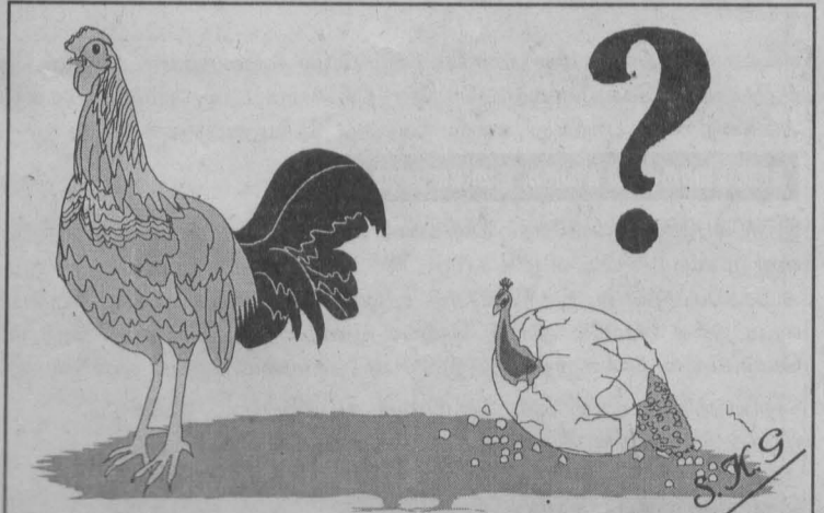
மலையகத்தில் ஓர் அதிசயம்

அமைப்புகள் ஆறின இடதுசாரி முற்போக்கு ஜனநாயக சக்திகள் அடையாளம் கண்டு அவற்றின் தேசவீரோத நடவடிக்கைகளைக் கண்டித்தும் எதிர்த்தும் வருகின்றன. அவையாவன 1. பங்களாவாத எதிர்ப்பு தேசிய முன்னணி. 2. வீரவீரான. 3. சங்கசபா 4. சிங்கள பாதுகாப்பு முன்னணி. 5. சிங்களவர் முன்னணி 6. மீட்டிங் கட்சி. இவை வெளிப்படையான பேரினவாத அமைப்புகளாகவும் தீவிரமாக இயங்கி வருபவையாகவும் உள்ளன. இவற்றை விட வெவ்வேறு அளவுகளில் சந்தர்ப்ப குழலுக்கு ஏற்றவாறு பேரினவாதம் பேசுவதும் அமைப்புகளும் கட்சிகளும் நாட்டில் இருக்கவே செய்கின்றன. அதிகாரத்தில் இருப்பவர் எவராயினும் அவர்களிடமும் இதே பேரினவாதக் கருத்துக்களே உறைந்து காண்ப படுகின்றன. எனவே நாட்டின் வளங்களை உறுஞ்சி உண்டு கொழுத்து உயர்வர்க்கமாகி வெள்ளை உடையிலும் காலி அங்கியிலும் பெளத்த சிங்களத்தின் பெயரில் நச்சுக் கருத்துக்களைப் பேரினவாதப் பேச்சுக்களாகக் கருதுவோரை சிங்கள உழைக்கும் வர்க்கம் உரியவாறு அடையாளம் காண்பதும் அத்தகைய சக்திகளை எதிர்ப்பதும் நிராகரிப்பதும் அடிப்படைத் தேவையாகிறது. இத்தகைய தேச வீரோத சக்திகள் முறியடிக்கப்படாத வரை இந்நாட்டிற்கு மக்களுக்கும் எந்த வித விமோசனமும் ஏற்படமாட்டாது.