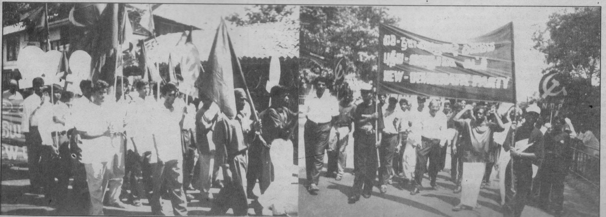
புதிய கி.து.சாரி முன்னணி கொழும்பில் நடத்திய மேதீன ஊர்வலத்தில் புதிய ஜனநாயகக் கட்சியின் பதாகையின் கீழ் அணிதிரண்டோர் ஒரு பகுதியினரை திங்கு காணலாம்.

தேர்தல் நெருங்க நெருங்க இன்னும் வாக்குறுதிகள் முன்வைக்கப்படும். ஆனால் மாகாண சபைத் தேர்தல் முடிந்ததும் இவையாவும் மறக்கப்பட்டுவிடும். மீண்டும் பொதுத் தேர்தல் வரும் சமயத்தில் தூக தட்டி தூக்கப்படும். மலையக மக்கள் ஏமாந்து கொள்ள ஏமாளிகள் அல்லவே.