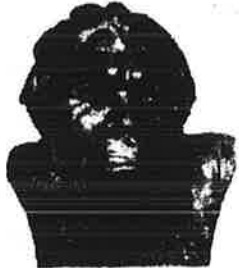
3 ★ சூதநிராய்ப்பஸ்