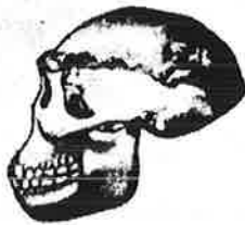
2 ★ பித்தகூர்திராய் மண்டியோடு.