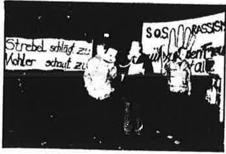
(ரபாநீகர்ணினி நடவழகீகையை தாநீதது திடமீபணீ உணர்வலடு.)

அரசியலி கடசீகர்ணட்டைய ரபாநீகாடுகீடு தாநீறண பறயலக தாநீயு தாடுதீததைதீ தநாடநீதது ரபாநீகாடு கிசீ நடவழகீகைகிணநி 19.6.62 5 சபைய 74 தீதயணீற தகதரசயீதணர். 94 தீதயணீற கிவநீக கிசீத வடகீடுதீ தநாடரீபட்டே பீயு வடுகைண ரசயீ யபீபட்டணர். கிவநீகர்ணினி கிணீரணர் சுகி (Zug) ஐசீ கீ நீத சூயநீ 16 தநாடகீகி 29 வடகீடு உடபட்டவநீகர்ணர். மநீற கிடுவடுகி கிணீரணர் ரகாநதீதாணி (Kanton Solothurn) கிணீரணர் சாபீகிணாணி (Kanton Schaffhausen) அகிய கிடநீகைணர் கீரீகீதவநீகர்ணர்.