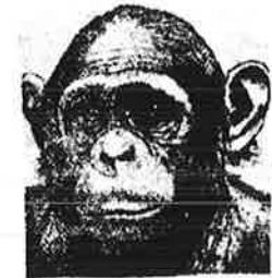
1 ★ சிம்பள்ளி

கிப்பலாது திரைமய மனிதமாத்ரமும் உணர்வாக தென்படுகின்றனர். மனித உணர்வியக (அறித்தும் உணர்) மாதிரி கயங்கு மும்பு ஆறம் அங்கம் கிடைத்தல் தெண்டது. அத்தாலு ஸாதிணைய - களி அறிவு தக்கியை தெருங்க வல்லா. சண்டலையைய ஆடு வதற்குரிய ஆறம் சூரநதி தெண்டமைமேயும்பு ஆறம்அங்கம் கிடைத்தமைம்குரிய காரணமாக கிருந்தது மும்பு ஆறத்தின் கருத சிந்திக்கத் தொடங்கின. அத்தாலு பூரி சந்து உறுமீன் சிந்தனை சந்தும் தெய்திர்ப்பாடானது அங்கியை கையும், கையும் சூர் ஆறத்தி நகர மைய்த்து. ஆபுறும் இன்னையும் சிந்தனையைத் துண்ட சிந்தனையானது செயலங்கம் பெரும் கருதுகருகிலே தெற்றது வித்தன. ஏற்கண்டால் தையானது மறுங்குலான வேலிகளிச் செய்க கடிய உறுப்புக மானிரண்டிநிருந்தனையும் இத்து சிக்கமாக கிருந்தது. அத்தும் காலங்களில் துடி மறு கம்பிந்து இன்னையெங்க கருமியற்றார உருவங்கிக தெண்டன. கத்தினி கருணா அலவ்யகமாக மாதிரின. அங்கம் கிருந்த பூரி மான்க்கியின் கத் - ஆறந்தகட்டம் துண்ட நுணை மான்க்கின உயர் தெய்திர்ப்புகளாகும் - x - ஆறத்தினும் மனிததுக்கும்கினயிலான மரினயிப்பிந்து கிடைப்பட்ட மனித குருக்கினி பின் மரு மறு ஆருக்கமாக அடக்களம்: