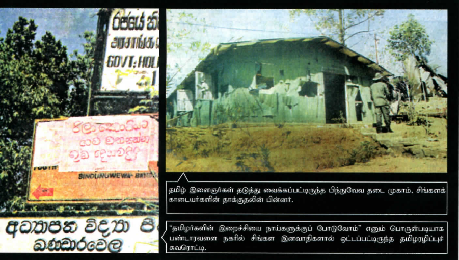
தமிழ் இளைஞர்கள் தடுத்து வைக்கப்பட்டிருந்த பிந்நுவேவ தடை முகாம். சிங்களக் காதையர்களின் தாக்குதலின் பின்னர்.