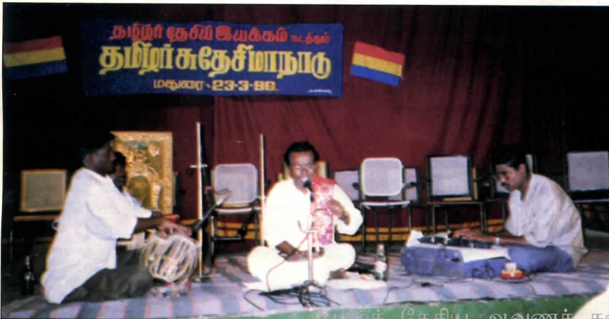
தமிழ்த் தேசிய ஆவணச் சுவடிகள்