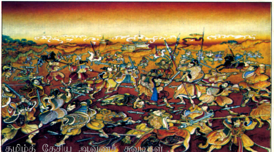
தமிழ்த் தேசிய ஆவணச் சுவடிகள்