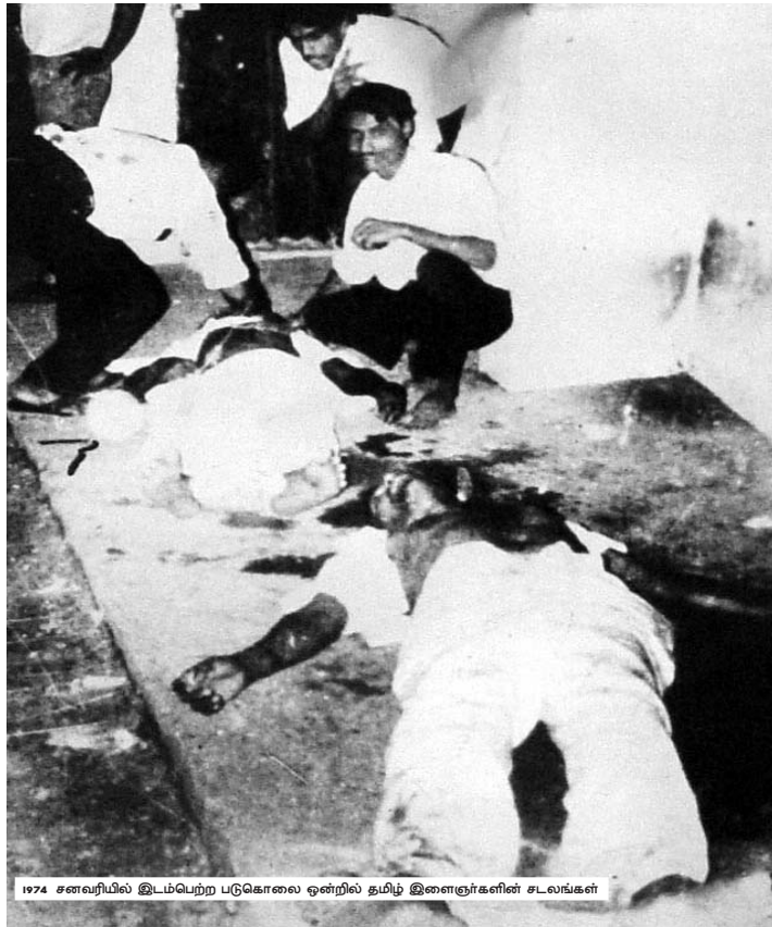
1974 சனவரியில் இடம்பெற்ற படுகொலை ஒன்றில் தமிழ் இளைஞர்களின் சடலங்கள்