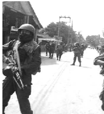
யாழ்துறையாடின் இராணுவ பிரசன்மை

தீ கிளர்ச்சி (DE KLERK) தலைமையிலான வெள்ளை அரசுக்கும் கருப்பினத் தலைவர்களுக்கும் இடையில் பேச்சுவார்த்தைகள் ஆரம்பமாகின. ஜனாதிபதி தீ கிளர்க் இழுத்த தடுப்பு உபாயத்தைக் கடைப்பிடித்தபோது அமெரிக்க தேசிய காங்கிரஸ் ஆதரவாளர்கள் மீதான படுகொலைத் தாக்குதல்களுக்கும் மறைமுக அணுமதி வழங்கினார். இங்காது சுதந்திரக் கட்சியினர் (INKATHA FREEDOM PARTY) அவருடைய முடிவால் வலியுறுத்தினார். ஒரு மில்லியன் நூறாயிரம் மக்கள் இக்கட்சிக்கு அரசினால் வழங்கப்பட்டது. பாரம்பரிய ஆயத்தங்களை பகிரங்கமாக எடுத்துச்செல்லும் உரிமையும் அவர்களுக்கு வழங்கப்பட்டது. ஜூலை 1990இல் தாக்குதல்கள் ஆரம்பமாகின. வெள்ளைநாடு பொலிசார் தாக்குதல் அணிகளுக்குப் பாதுகாப்பு வழங்கினர். இதுபற்றி பொலிஸ் ஆணையருக்கு முறைப்பாடு செய்யப்பட்டபோது அவர்