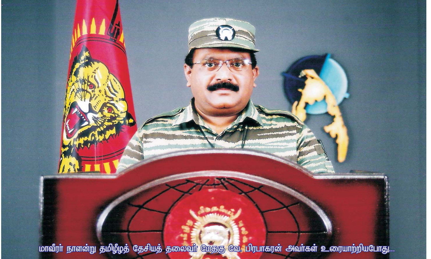
மாவீரர் நாளன்று தமிழீழத் தேசியத் தலைவர் றேதகு வே. பிரபாகரன் அவர்கள் உரையாற்றியபோது...

மூன்று தசாப்தங்களாகத் தொடர்ந்த எமது வீர விடுதலைப் போராட்டத்தில் எமது மாவீரர்கள் புரிந்த மகத்தான தியாகங்கள் காரணமாக ஒப்பற்ற போரியற் சாதனைகளை நாம் நிலைநாட்டினோம். உலகமே வியக்கும் வகையிற் போர் அரங்குகளில் எதிரிப் படைகளை விரட்டியடித்து வெற்றிகளை ஈட்டினோம். சிங்கள இராணுவ ஆக்கிரமிப்புக்கு ஆளாகியிருந்த எமது தாயக மண்ணின் பெரும் பகுதியை மீட்டெடுத்து அங்கெல்லாம் எமது நிர்வாக ஆட்சியதிக்காரத்தை நிறுவினோம். உலக நாடுகளின் உதவியுடன் கட்டியெழுப்பப்பட்ட சிறீலங்கா அரசினது ஆயுதப் படைகளுக்கு ஈடாகப் படை வலுச் சமநிலையை நிலைநாட்டினோம். தமிழீழ மக்களின் தேசிய விடுதலைப் போராட்டத்தைச் சர்வதேசமயப்படுத்தி, உலகத்தின் கவனத்தை எம்மீது திருப்பினோம். எனினும் எமது மாவீரர் கண்ட இலட்சியக் கனவு இன்னும் நிறைவுபெறவில்லை. எமது தாயகமண் இன்னும் முழுமையாக விடுதலை (உரையின் தொடர்ச்சி 15ஆம் பக்கத்தில்)