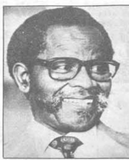
ANC தலைவர் ஆலிவ் டாம்போ பலவந்தமாக இடம் பெயர்க்கப் பட்டு வளமற்ற, வறண்ட வானூர்தர் பிரதேசங்களில் கட்டாயமாக குடியமர்த்தப்பட்டனர்.

இந்த இன ஒருக்குறல் சட்டங்கள் கறுப்பின மக்களின் சகல மனித உரிமைகளையும் பறித்ததுடன் அவர்கள் அவர்களது சொந்த மண்ணிலேயே அடிமை யாக்கியது. இச் சட்டங்களின் பிரகாரம் கறுப்பின மக்கள் தமது பாரம்பரிய பிரதேசங்களிலிருந்து,