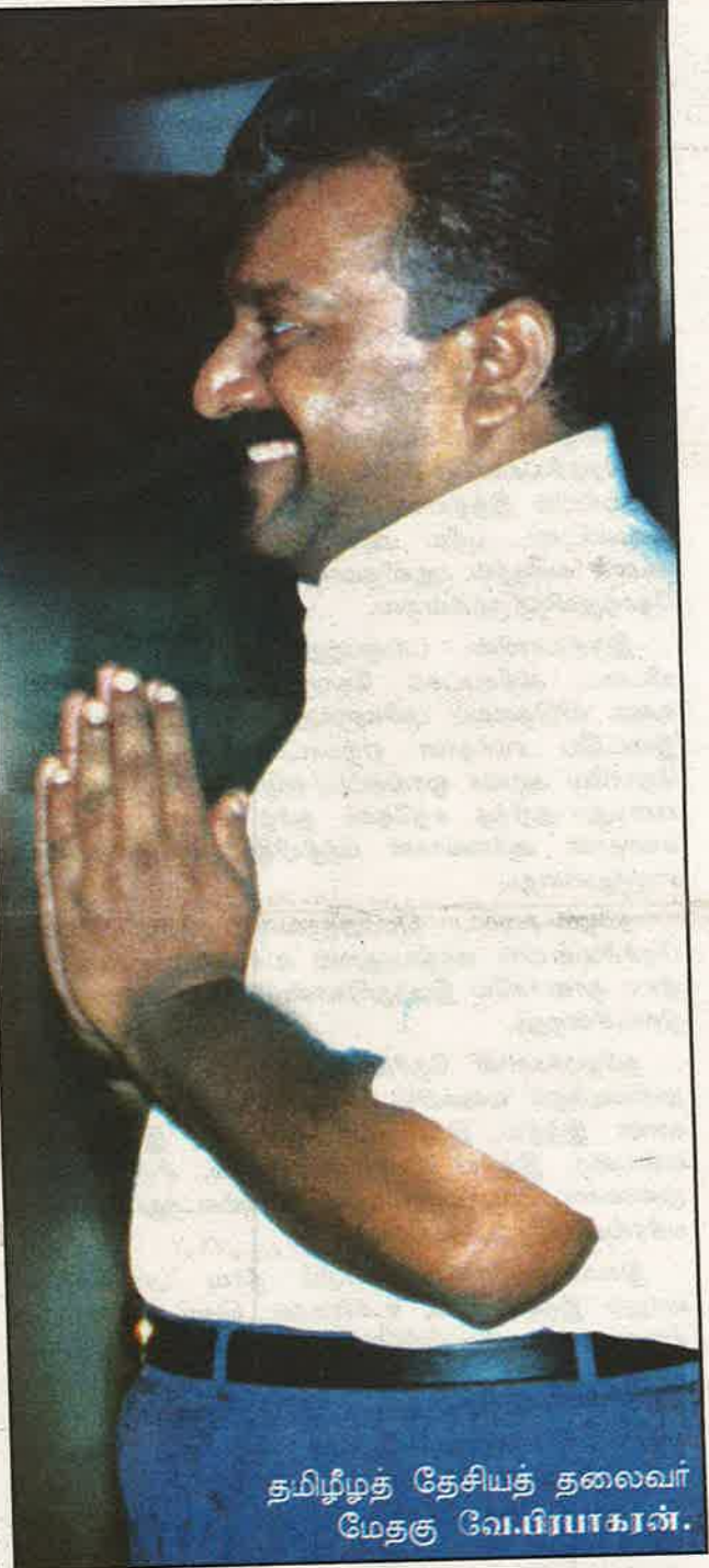
தமிழீழத் தேசியத் தலைவர் மேதகு வே.பிரபாகரன்.

ரணில் தலைமையிலான புதிய சிறீலங்கா அரசு இதற்கு சாதகமான முறையில் நடந்துகொண்டால், ஒரு மாதகால போர்நிறுத்தத்தை தொடர்ந்து நீடிப்பது குறித்தும் விடுதலைப் புலிகள் தமது அறிக்கையில் தெரிவித்திருக்கின்றனர்.