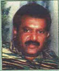
தமிழீழத் தேசியத் தலைவர் மேதகு வே. பிரபாகரன் அவர்கள்

அடக்குமுறையாளர்கள் போராளிகளை அழிப்பதில் காட்டும் தீவிரத்தைவிட, பொதுமக்களின் ஆன்மீக உறுதியை உடைக்க வேண்டும் என்பதில் தான் அதிக அக்கறை காட்டுகின்றனர்.