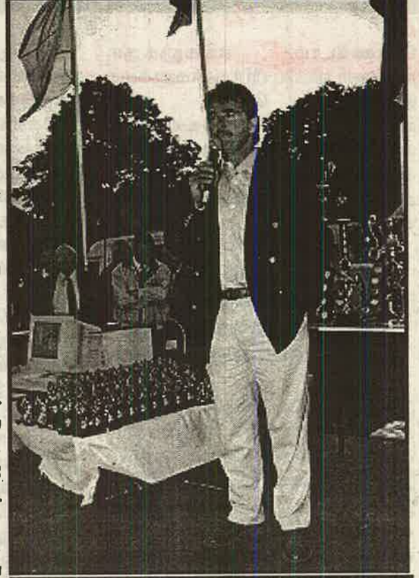
பிரதம அதிதியாகக் கலந்துகொண்ட இங்கிலாந்து துடுப்பெடுத்தாட்ட அணியின் முன்னாள் அணித்தலைவரான அலன் லாம் உரையாற்றுகையில்....