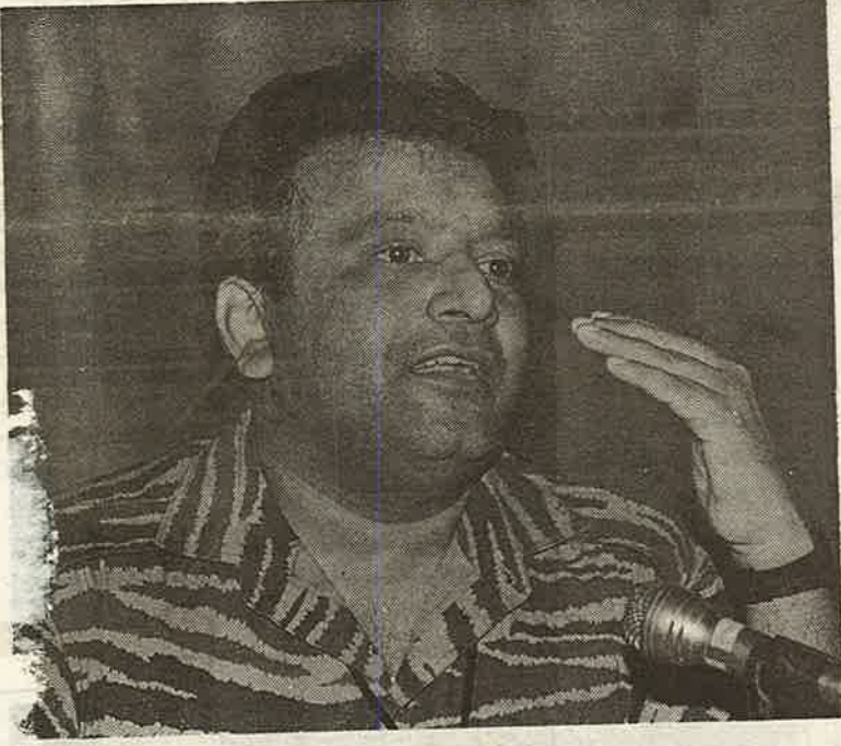
எனத் தமிழீழத் தேசியத் தலைவர் திரு. வே. பிரபாகரன் விடுதலைப் போராட்டத்தை மழுங்கடிக்கச் செய்வதே இதன்