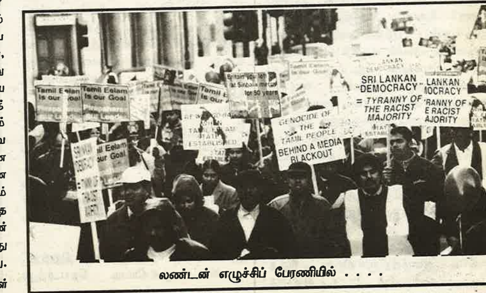
லண்டன் எழுச்சிப் பேரணியில் . . . . .

சந்திரிகா அரசு பதவியேற்றதும் தமிழர்களின் இனப்பிரச்சனைக்கு தீர்வு கிடைக்கப் போகிறது என்று, உலகம் நம்பவைக்கப்பட்டது. சந்திரிகாவின் சாதாரணமான பேரினவாத நிலைப்பாட்டால் புலிகளின் அரசியல் உறுதியை வெற்றிகொள்ள முடியவில்லை. எனவே, தமிழ் மக்கள் வேறு, புலிகள் வேறு என்று வகைப்படுத்திக் காட்டிய அம்மையார், தமிழர்களுக்குத் தீர்வுத் திட்டம் புலிகளுக்குப் போர்த்திட்டம் என்று கூறி மாபெரும் படை நகர்வை தமிழர் நிலப்பரப்பில் அரங்கேற்றினார். இன அழிப்புக்கான போர், சமாதானத்துக்கான போர் என்று பெயர் மாற்றம் செய்யப்பட்டது. தமிழர் நிலத்தை ஆக்கிரமிப்பது என்ற பேரினவாதத்தின் இலட்சியம், தமிழ் மக்களை விடுவிப்பது என்று வார்த்தை மாற்றம் செய்யப்பட்டது. சிங்களப் படையெடுப்பை புலிகள்