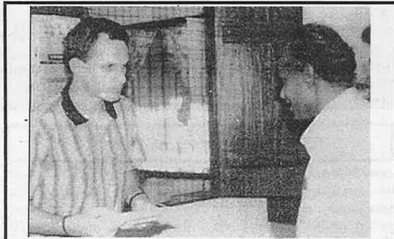
சர்வதேச செஞ்சிலுவைச் சங்கப் பிரதிநிதியிடம் மகஜர் கையளிக்கையில்.....

தமிழீழ விடுதலைப் போராட்டத்தில் தலைவர் பிரபாகரன் அவர்கள் காட்டித் தந்த அடிப்படை நிலைப்பாடு ஒன்று எமக்கு வழிகாட்டியாக உள்ளது. தமிழீழ மக்கள் மட்டுமே தமிழீழ விடுதலையை வென்றெடுக்க முடியும் என்பதும் அழுத்தங்களுக்குப் பணியாமல் நிமிர்வதே போராட்டத்தின் வெற்றிக்கு அடிப்படையானது என்பதுவுமே அந்த நிலைப்பாடாகும். இந்த நிலைப்பாடு சர்வதேச அரங்கில் தமிழீழ விடுதலைப் போராட்டத்திற்கும் மிகப் பொருந்தும். பல்வேறு காரணங்களுக்காக பல்வேறு சர்வதேச நிலைமைகள்