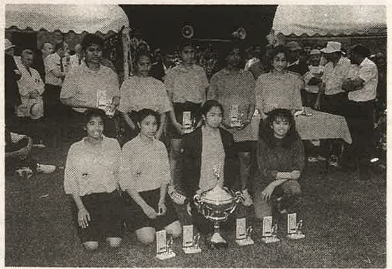
வலைப்பந்தாட்டத்தில் முதலாம் இடத்தைப் பெற்ற கண்டிக்குளி மகளிர் கல்லூரி அணிபினர்...