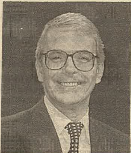
முன்னாள் பிரதமர் ஜோன் மேஜர்

ஏற்கனவே இங்கிருந்த நிலைமைகள், தொழிற்கட்சியின் வெற்றியினையும் பழமைவாதக் கட்சியின் தோல்வியினையும் கணித்துக் கொள்ளக் கூடியதாகவே இருந்தது. ஆனால், தேர்தல் முடிவுகள் வரத்தொடங்கிய பின்னரேயே பழமைவாதக் கட்சி துடைத்தெறியப்பட்டுக் கொண்டிருக்கின்றது என்பது தெரிய வந்தது. சுமார் 165 ஆண்டுகளுக்குப் பின்னர் இம்முறையே வரலாறு, இவ்வுடவில் ஓர் பெரிய வெற்றியைத் தொழிற்கட்சிக்கு ஏற்படுத்தியது. நாடு நகரமெங்கும் மே தினத்தை யொத்த வகையில் சிவப்பு வர்ணக் கொடிகள் அலங்கரித்துக் கொண்டிருந்தது. மக்கள் அரசி