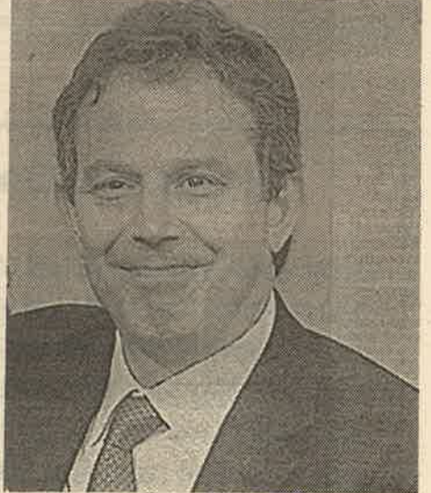
புதிய பிரதமர் ரொனி பிளேயர்

வழமைபோல், பல நாட்டுத் தலைவர்களும் தமது வாழ்த்துக்களைப்