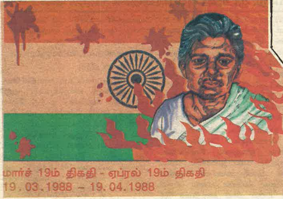
மார்ச் 19ம் திகதி - ஏப்ரல் 19ம் திகதி 19.03.1988 - 19.04.1988

வீரவணக்கம் தமிழினம் வாழ தன்னுயிர் தந்த தமிழ்த் தாய் ! அன்னை யூபதிக்கு 9 ஆம் ஆண்டு நினைவாக எமது வீரவணக்கம்.