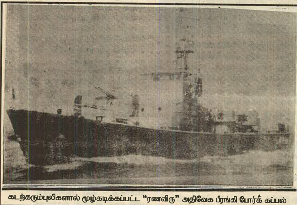
கடற்கரும்புலிகளால் முழுகடிக்கப்பட்ட "ரணவிரு" அதிவேக பிரங்கி போர்க் கப்பல்

ஏக்கத்தோடு பார்த்திருக்க - தொடர்ந்த கதையிலோ - களத்தில் போரணிகளை வழிநடாத்திக் கொண்டிருந்த ஆற்றல் மிகு தளபதிகளுக்கு உடனுக்குடன் ஆலோசனைகளை வழங்கி, கள நிலைமைகளின் மாற்றங்களுக்கேற்ற விதமாக அறிவுறுத்தல்களைக் கொடுத்து, சமரரங்கைத் தொடர்ச்சியாக நெறிப்படுத்திச் சென்ற தலைவர் பிரபாகரனின் போருபாய விபுலங்களுக்குள்