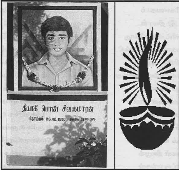
மாவீரனை, தியாகி சிவகுமாரனை தமிழினம் என்றும் மறக்காது விடுதலையை வேண்டி நிற்கும் நினைவுகூர்ந்து நிற்கின்றது. ௨

1974 ஆனித் திங்கள் 5ம் நாள்.... தமிழீழம் ஒரு புறம் பெரும் சோகத்தில் மூழ்க, மறுபுறம் தமிழ்மக்கள் விடுதலைக்காய் எழுச்சி கொண்டெழுந்த மறக்கமுடியாத பொன்னான். சிறிலங்காவின் கூலிப்படைகள் தமிழீழமெங்கும் தமிழ் இளைஞர்களை வேட்டையாடித் திரிந்த காலம் அது. தமது சொந்தப் பிழைப்பிற்காகத் தம்மினத்தையே சிங்களக் கூலிப்படைகளுக்குக் காட்டிக் கொடுத்து, மிகக்கீழ்த்தரமான அரசியல் நடாத்திய எட்ப்பர் கூட்டம் மலிந்த காலம். தமிழர்களை அடிமைப்படுத்தி இனஅழிப்புச் செய்துவந்த சிங்கள ஆட்சியாளர்களுக்கு எதிராக ஆயுதம் ஏந்திப் போராடிய தியாகி சிவகுமாரன் அவர்கள் கனப்பவியான நாள். இன்று இந்நாள் 22 ஆண்டுகளைச் சந்தித்து விட்டாலும் இந்நாளின் சிறப்புக்குரிய