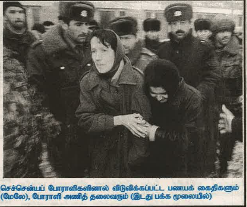
செச்சென்யப் போராளிகளினால் விடுவிக்கப்பட்ட பணயக் கைதிகளும் (மேலே), போராளி அணித் தலைவரும் (இடது பக்க முலையில்)