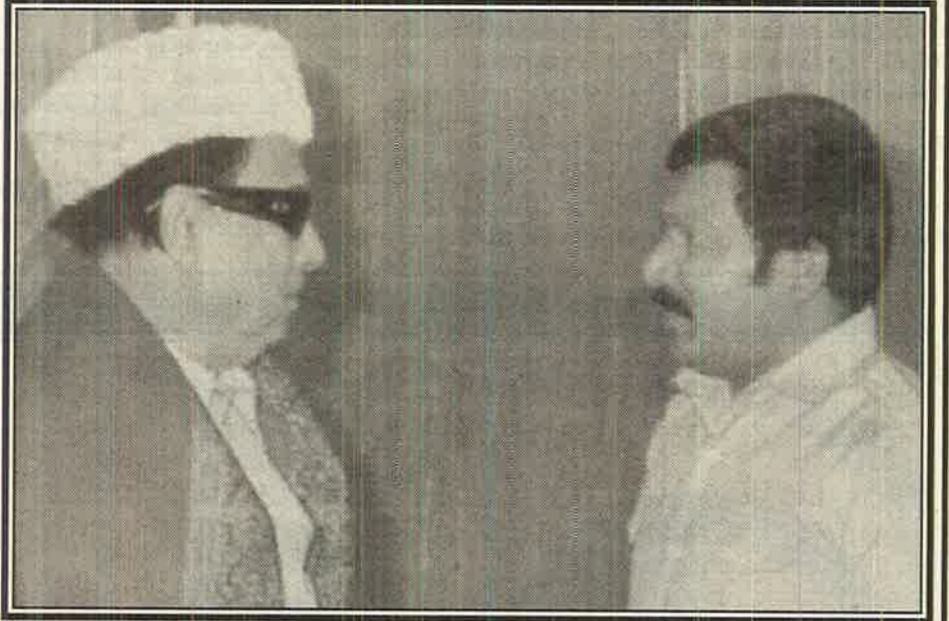
"பொன்மனச் செம்மலும்" "திண்மனச் செம்மலும்"

அந்த 9 மணி நேரமும் தலைவர் பிரபாகரனுக்குக் கடும் சோதனையாக இருந்தது. தமிழீழ மக்களின் அரசியற் தலைவியை ஆட்டம் காண வைக்கப் பதவியாசை, சொகுசான வாழ்க்கைக்குரிய வசதி வாய்ப்புக்கள் தரப்படும் என்ற பொருளாசை என்பன தலைவரின் முன் வைக்கப்பட்டன.