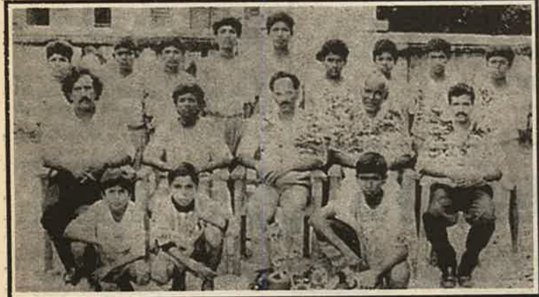
வெற்றிக் கிண்ணத்தை பெற்றுக் கொண்ட நாவாந்துறை றோ.க.வித்தியாலய அணியினர்