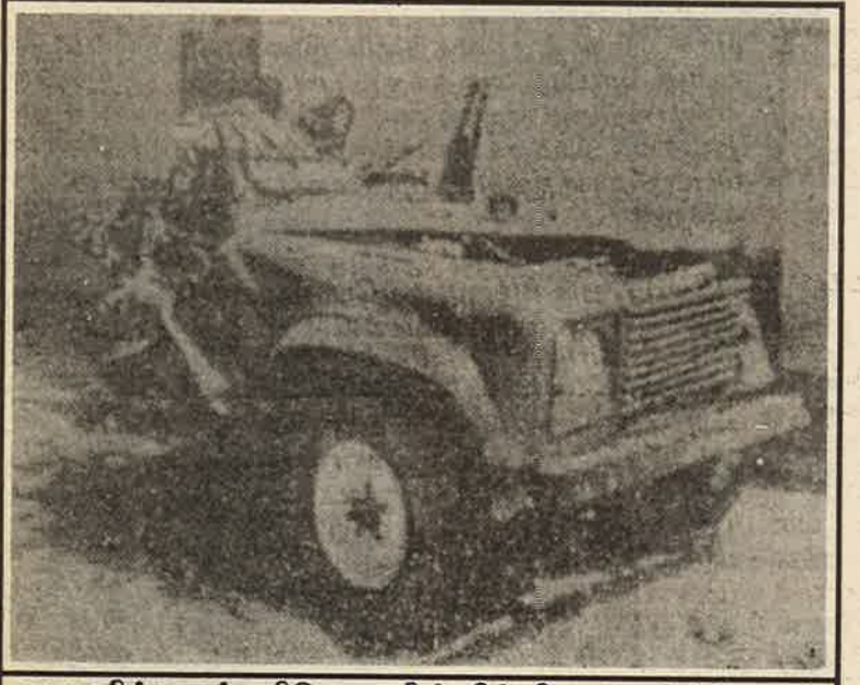
அராலிக் கண்ணிவெடியில் சிக்கிய லான்ட்ரோவர்.