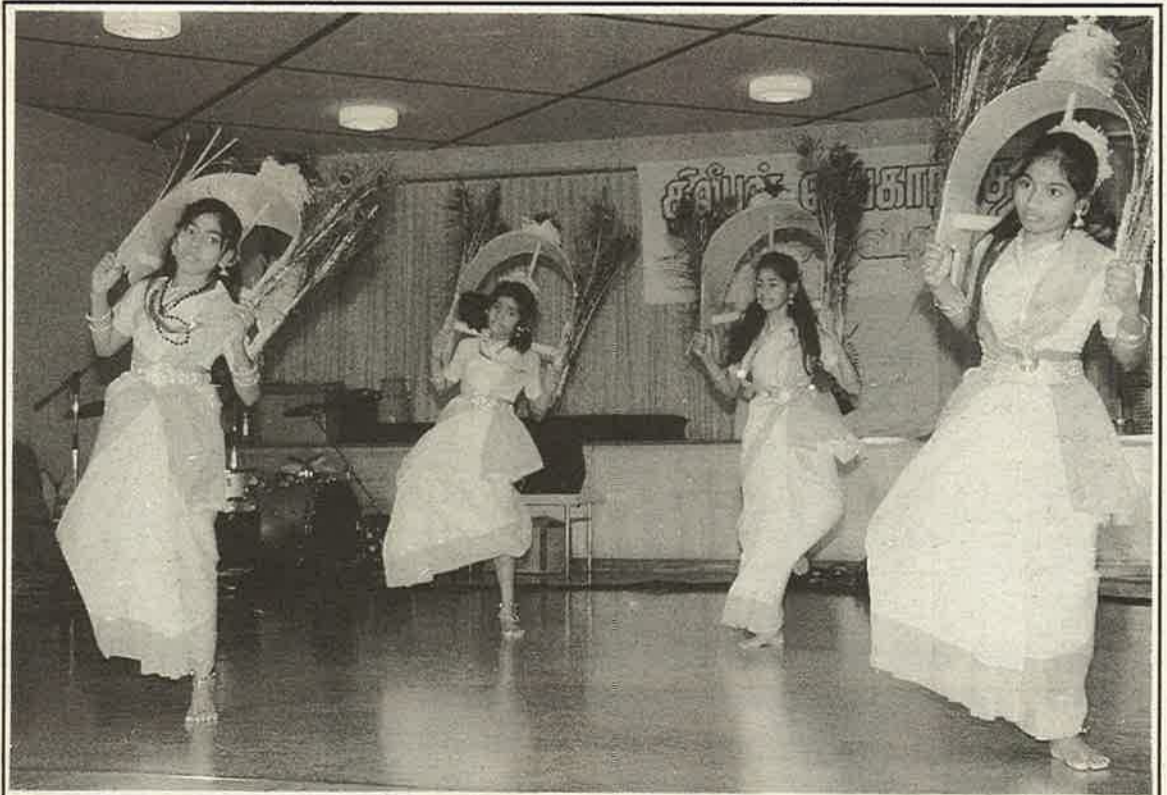
17.09.1994 சனிக்கிழமையன்று சுவீசில் நடாத்தப்பட்ட திலீபன் ஞாபகார்த்த எழுச்சிவிழாவில் இடம்பெற்ற கலை வடிவங்களில் ஒன்று.

பெற்ற பேச்சுக்களும் திலீபன் அவர்களின், தமிழ் விடுதலைப் போராட்டத்திற்கான அர்ப்பணிப்புக்களையும், தியாகத்தினையும் வெளிப்படுத்தி நின்றன. அத்துடன், இவ்வெழுச்சி விழா நிகழ்வுகள் யாவும், விழாக் காண வந்த எம்மக்களின் விடுதலை உணர்வுக்கு மேலும் உரமூட்டு வதாகவும் இருந்துள்ளன. ■