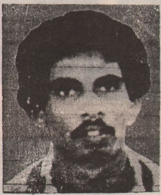
கரும்புலி கப்டன் மில்லர் (வல்லிபுரம் வசந்தன்) துன்னாலை, யாழ் 1.1.1966 - 5.7.1987

என நண்பன் ஒருவன் வந்து சொன்னான். வீட்டில் எல்லோரும் அழுதார்கள். அம்மாவால் தாங்கிக் கொள்ள முடியவில்லை. அவளும் அழுதாள். இருந்தாலும் சமாளித்துக் கொண்டாள். தன்பிள்ளை எது செய்தாலும் நன்மைக்காகத்தான்