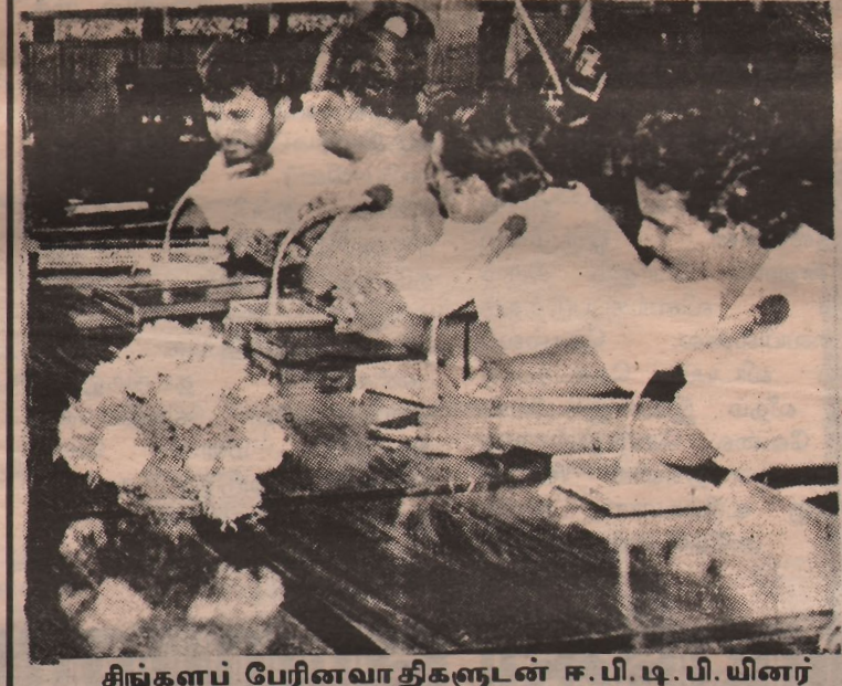
சிங்களப் பேரினவாதிகளுடன் ஈ.பி.டி.பி.யினர்

நாபா, தேவாவை இயக்கத்திலிருந்து நீக்கிவிட்டார். இதற்கு, தேவா மீது அவர்கள் வைத்த குற்றச் சாட்டுக்களில் முக்கியமானவை இரண்டு. ஒன்று, அவர் நிதி மோசடிகளில் ஈடுபட்டார் என்பது. மற்றது, அவர் தமிழகத்திலுள்ள நக்சலைட்டுக் களுடன் தொடர்பு வைத்திருந்தார் என்பது. தவிர, சூளைமேட்டுச் சம்பவமும் ஒரு காரணமாகக் கூறப்பட்டது.