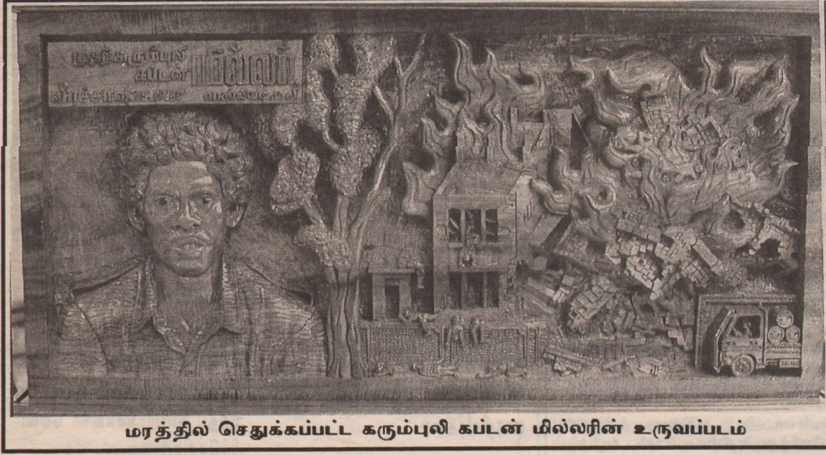
மரத்தில் செதுக்கப்பட்ட கரும்புலி கப்டன் மில்லரின் உருவப்படம்

இப்படித்தான் இன்னமொரு நாள். மோட்டார் சைக்கிளில் வந்த இருவர், எரிபொருள் தீர்ந்து போனதால் வீட்டிற்கு முன்னால் நின்று திட்டாடிக் கொண்டிருந்தார்கள். எங்கோ இருந்து வீட்டுக்குத் திரும்பிக் கொண்டிருந்த மில்லர் அவர்களிடம் விடயத்தைக் கேட்டறிந்தான்.