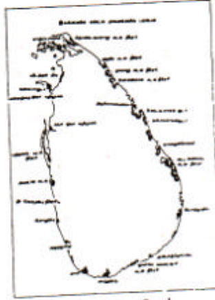
உரு. 95 9.4 கண்டல் தாவரங்களின் பரம்பலைக் காட்டும் படம்

இதனைத் தவிர களப்புகள், கழிமுகங்கள் என்பவற்றின் கரையோரங்கள் அரிக்கப்படுவ திலிருந்து பாதுகாக்கப்படுவ தற்கும் இக்கண்டல் தாவரங்கள் பயன்படுகின்றன. இங்கு கண்டல் பிரதேசத்திலுள்ள தாவரங்கள் உயிரினங்கள் (விலங்குகள்) பல்வேறு வகையினவாகக் காணப் படுவதால் உயிரியல் பாடத்தைக் கற்கும் பலருக்கும் கண்டல் தாவரச் சூழல் திறந்த விஞ்ஞான ஆய்வு கூடமாகக் காணப்படு கிறது. ஆகவே இக் கண்டல்கள் எவ்வளவு முக்கியத்துவம் வாய்ந்த