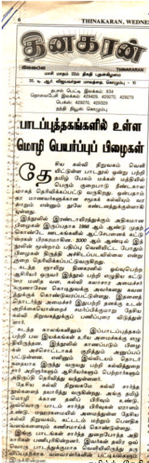
Figure 5 Editorial in State owned Tamil daily