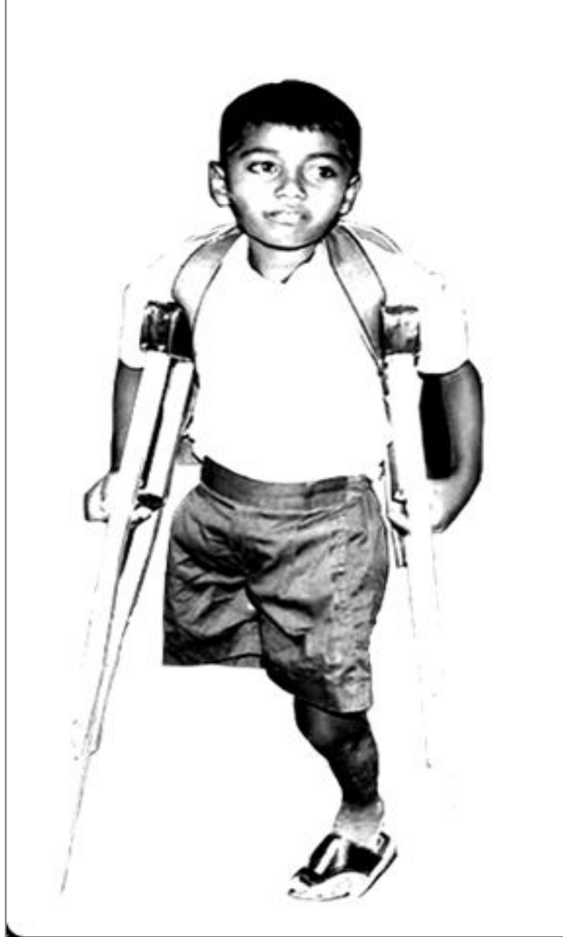
வடகிழக்கு மனித இரணைச் செயலகம்