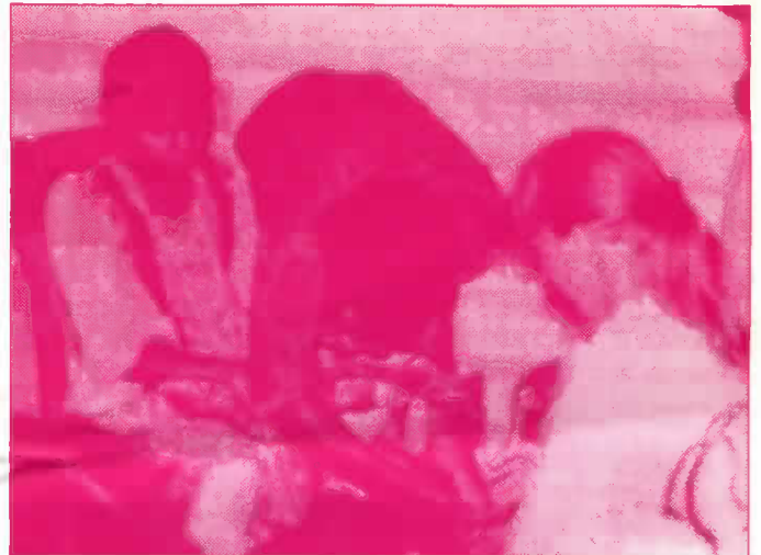
காலை இழந்த பெண்பிள்ளைக்கு வெண்புறா நிறுவனத்தைச் சேர்ந்தவரால் செயற்கைக்கால் பொருத்தப்படுகின்றது. எம்.எஸ்.எவ்.பிரதிநிதி அதை பார்வையிடுகின்றார்.

இக்கடனுதவிமூலம் தமது பயிர்ச்செய்கை நடவடிக்கைகளை இவ்விவசாயிகள் விஸ்தரிக்கவுள்ளனர்.