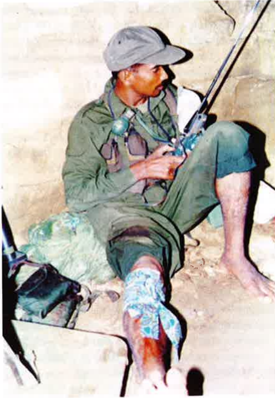
பரந்தன் களத்திற் காயமுற்றும் சண்டையை வழிநடத்தும் அணித்தலைவன்