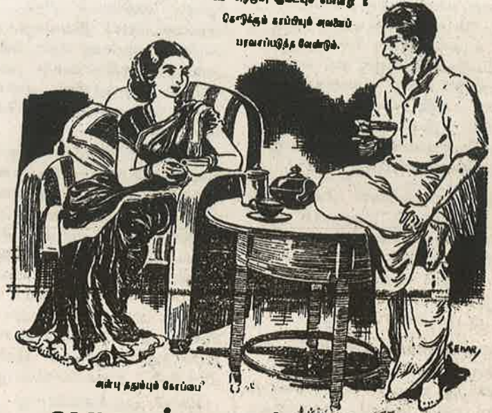
காப்பி தரும் சோப்பி

உள் அறகம், சூடையும் போன்ற 6 கோட்டுக் காப்பியும் அவைப் பரவலுடைய வேண்டும்.