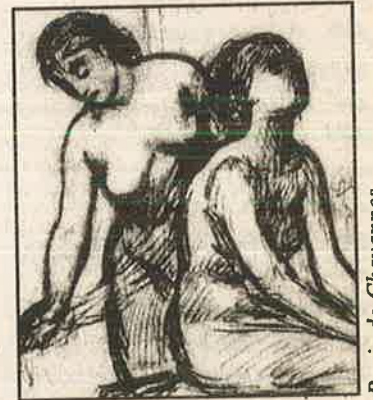
Pavis de Chavannes

போலிஷ் மொழியிலிருந்து மொழிபெயர்ப்பு : செஸ்லாவ் மிலோஸ்