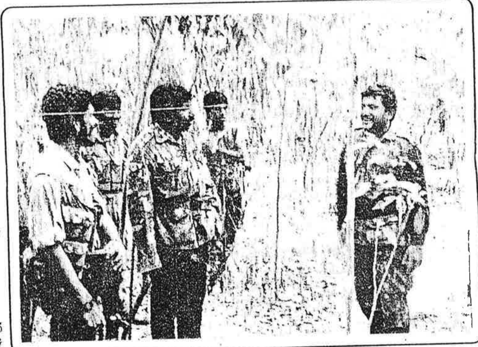
பெயர் மங்கி, மறையத் தொடங்குகிறது. மாத்தையாவோ தொடர்ந்தும் மௌனமாகத் தானுந் தன் பாடுமாக இருக்கிறார்.

ஓகஸ்ட் மாதம் 2ம் திகதி மாலை ஓகஸ்ட் மாதம் 3ம் திகதி காலை இடையில் ஓரிரவு. மாலை, இரவு மறுநாள் காலை என் முப்பொழுதுகளை எயும் உள்ளடக்கும் 21 மணி நேர அந்த நீண்ட இரவில் யாழ்ப்பாணத்திலே வன்னியிலும் புலிகள் ஒரு மாபெரு ஒப்பரேஷன் ஒன்றை நடத்திக் ஏறக்குறைய சம காலத்தில் அல்ல சொற்ப கால அவகாசத்தில் அடுடுத்துப் பல இடங்களில் புலிப் போராளி பாய்ந்தனர். ஏறக்குறைய ரெட். ஈ.பி.ஆர்.எல்.எப். இயக்கங்களைத் தடு செய்தபோது புலிகள் செயல்பட்ட போன்ற கட்டுக்கோப்பு, சீரான அவகுப்பு, செயற்பாடு. ஆனால் அப்பே நடந்தது போல் ரத்தம் சிந்தப்படவில்லை ஒரு ரத்தம் சிந்தா ஒப்பரேஷனாகவே அமைந்து விட்டது. புலிகளின் இம்முறை மாற்றான் அல்லது அவல். களை எடுப்புத் த இயக்கத்துக்குள்ளும் இயக்கத் அண்டியும் இருந்த சிலரைச் சுகத்தின் பேரில் கைது செய்ததை நடந்தது. இயக்கத்தில் இருந்த இயக்கத்தை விட்டு விலகிய சிலர், முன்னணிக் கிளைகளின் முன் உறுப்பினர்கள் சிலர், விடுதலைப் புலி நெருங்கிய ஆதரவாளர்கள் சிலர், அரசு செயற்பாடு மிகுந்தோர் சிலர் என்று பதரப்பட்டவர்கள் அன்று புலிக் குறிகளானார்கள். ஒருவருமே புலிக்